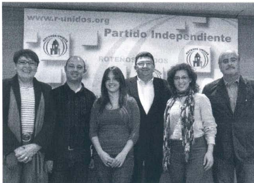
Una lista plural y plural de la candidatura