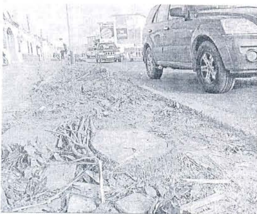
Efectos de las obras en la vegetación de este vial de acceso de la ciudad.

Esta ONG, que ha acusado a la coalición PSOE-CISanlúcar de ser "el Gobierno local que ha cometido más casos de arboricidio en toda la Democracia de la ciudad", asevera que "la mayoría de los casos de exterminio masivo" se ha producido en las obras desarrolladas con cargo a los planes extraordinarios del Estado y la Junta de Andalucía, como las refor-