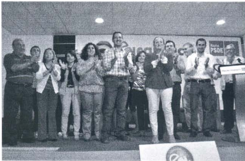
La alcaldable junto a los concejales

En la noche de ayer viernes, los socialistas quisieron presentar parte del programa electoral con el que se presentarán a las elecciones municipales, con el fin de que se conozcan públicamente las medidas que adoptarán de cara a la próxima legislatura en el caso de hacerse con el gobierno dentro del Ayuntamiento de Rota.