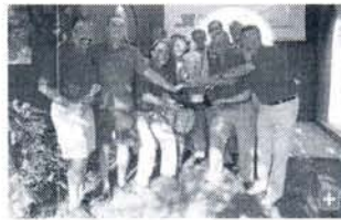
Los vencedores posan con el trofeo al término de la final.

El Club Bahía de Algeciras sucedió a Montecastillo y Almenara al adjudicarse la tercera edición de la Copa Diputación tras imponerse en la última prueba, disputada en el Benalup Golf & Country Club. El equipo campogibaltareño fue el que mejor se adaptó a una jornada muy ventosa, acreditando una tarjeta colectiva meritoria que le permitió remontar desde la quinta posición desde la que partía hasta el liderato final.