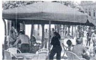
La hostelería sigue siendo una de las actividades en la que se contrata a más extranjeros en Jerez.

6 comentarios 2 votos Me gusta 1 COMPARTIR