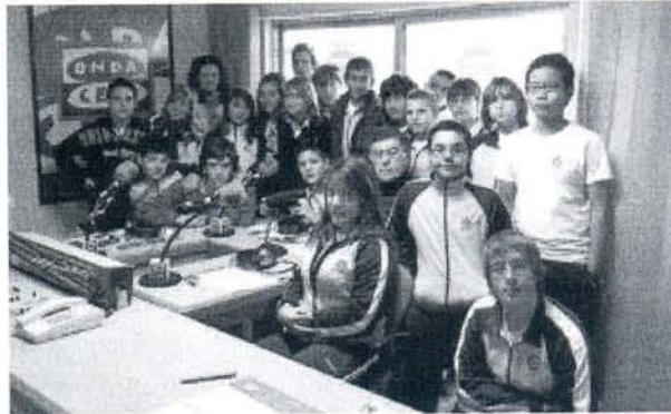
Los alumnos, en Onda Cero Rota.

El pasado jueves 20 de enero, los alumnos de ESO del Colegio Ntra Sradel Rosario - Salesianos de Rota visitaron las instalaciones de Onda Cero Rota, situada en la calle Ponce Cordones, 1. Durante la visita, los alumnos se interesaron por el funcionamiento de la emisora, y se les explicó algunos de los entresijos de la programación, tanto local como nacional y, en especial, de la sección de deportes. Hay que recordar que ésta no es la primera visita que realiza un grupo de alumnos de la provincia a las instalaciones de esta emisora. Así, el mismo día, los alumnos del IES Jorge Juan, centro de San Fernando, visitaron las instalaciones de Onda Cero Cádiz, que se encuentran en la plaza Asdrúbal 16 bajo.