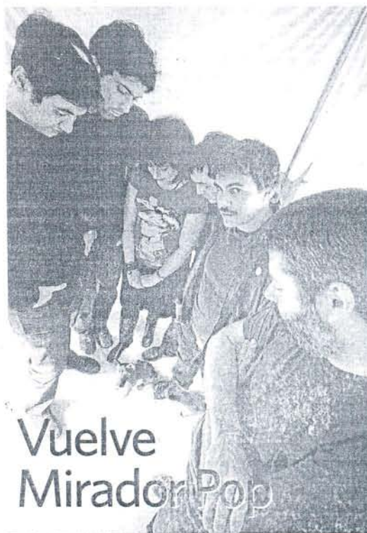
Una fotografía del grupo sevillano Blacanova.