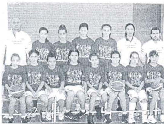
Selección gaditana femenina de minibasket.