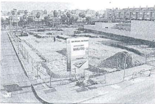
Solar donde se ubicará el nuevo centro de Alzheimer, en Rota.