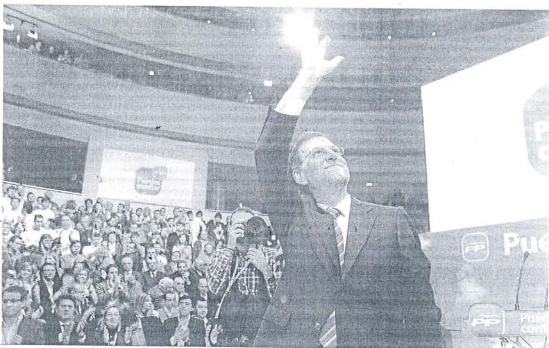
Rajoy saluda ayer en los momentos previos a la clausura de la Convención Nacional que el PP celebró en Sevilla.