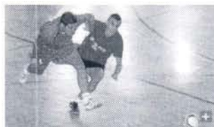
Lance de uno de los encuentros disputados en casa.