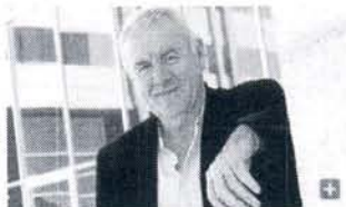
Cayo Lara, fotografiado días atrás en Cádiz, antes de un acto con las juventudes de Izquierda Unida.

El único partido que puede poner en práctica políticas económicas radicalmente opuestas a las que propugnan PSOE y PP es Izquierda Unida. Éste es el mensaje que viene repitiendo constantemente su coordinador federal, Cayo Lara, que confía en que Andalucía aporte el 20-N un número importante de diputados izquierdistas (Sevilla, Málaga y Cádiz, son por este orden, los territorios con más opciones) pero, también, que permita el nacimiento de lo que él llama la izquierda alternativa.