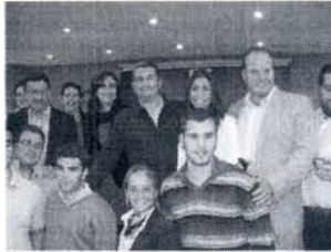
▼ Sanz con el PP roteño. · Autor: O. P. Este artículo dispone de 1 imagen adicional

El Partido Popular de Rota abría esta tarde su campaña electoral con la presencia del secretario general del Partido Popular de Andalucía, Antonio Sanz, así como de la plana mayor del partido a nivel provincial, encabezada por el presidente de la Diputación de Cádiz José Loaiza.