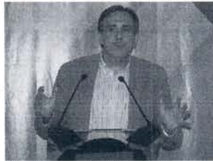
Valeriano Gómez, Ministro. Este artículo dispone de 3 imágenes adicionales