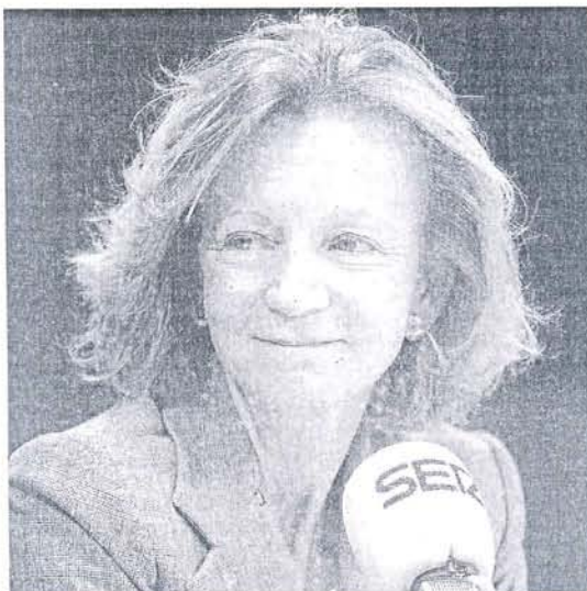
La vicepresidenta segunda del Gobierno, Elena Salgado, ayer.

Precisamente, en el tema de las pensiones, ayer tuvo lugar el cuarto encuentro entre el Gobierno y los sindicatos para buscar un acuerdo. La cita concluyó tras menos de dos horas y los participantes quedaron en analizar por separado el impacto económico de las medidas y volver a verse en unos días. A la reunión asistieron los secretarios generales de UGT, Cándido Méndez, y CCOO, Ignacio Fernández Toxo, el minis-