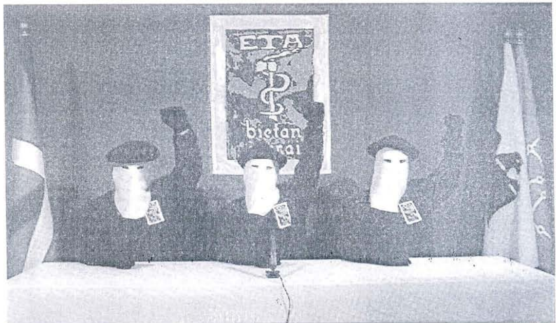
Imagen de los tres miembros de ETA durante la lectura del comunicado de alto el fuego.

Por contra, auguró que los terroristas "van a ser mucho más ambiguos y en términos mucho más eufemísticos para prolongar una tregua, y será sobre la base de una ETA que se mantiene vigilante", que plantee "un precio a su fin, que la democracia no puede admitir".