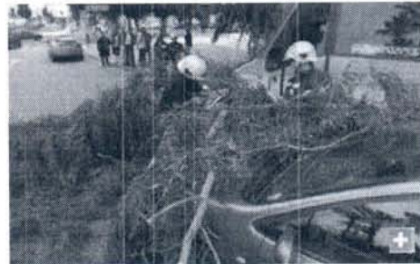
La retirada de árboles caídos en la vía pública, una de las actuaciones más habituales

Además, el Consorcio de Transportes de la Bahía de Cádiz ha informado de la suspensión del servicio marítimo en las expediciones que unen las localidades de El Puerto de