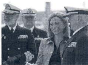
▼ Carme Chacón.

La ministra de Defensa, Carme Chacón, aseguró ayer que la decisión de la instalación en la Base Naval de Rota del Escudo Antimisiles de la OTAN "sumará dos activos para España", por convertirse en punto geoestratégico "fundamental" en el mundo y porque la Bahía de Cádiz contará con unos "retornos económicos y laborales muy importantes".