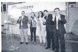
Antonio Sanz en una visita.

La semana pasada era la alcaldesa de Cádiz y candidata al Congreso, Teófila Martínez, la que visitaba la localidad, y en esta ocasión será el secretario general del PP de Andalucía y diputado autonómico, Antonio Sanz, quien ofrecerá un mitin bajo el lema 'Por el empleo, súmate al cambio'.