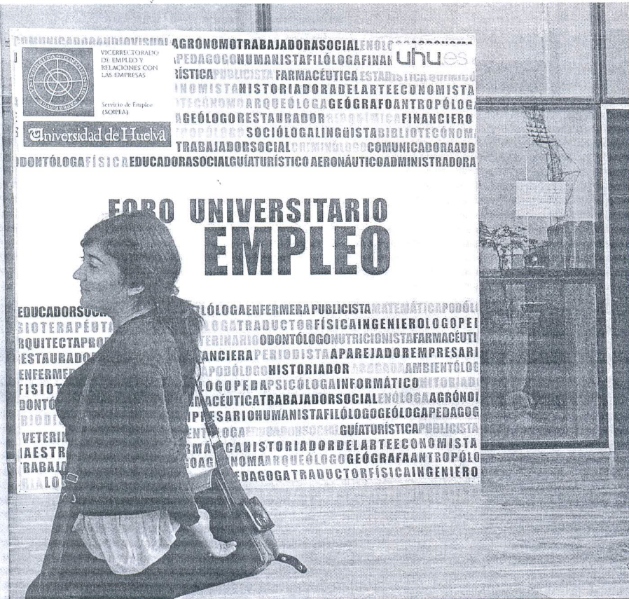
curso por la Universidad de Huelva.

LOS DOS LASTRES El escaso nivel en idiomas se convierte en el primer obstáculo de los universitarios gaditanos para tener trabajo