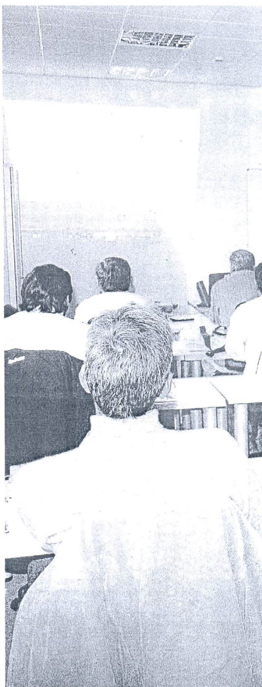
Ex trabajadores de Delphi, en uno de los cursos impartidos.

Las ayudas continúan. Después se publicó en el BOJA de 20 de enero de 2011 la resolución de la Consejería de Empleo "por la que