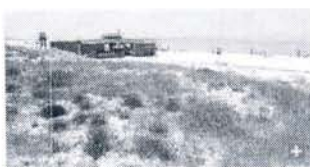
Uno de los chiringuitos que se instalan en verano en la playa de Sancti Petri de Chiclana, en una imagen de archivo.