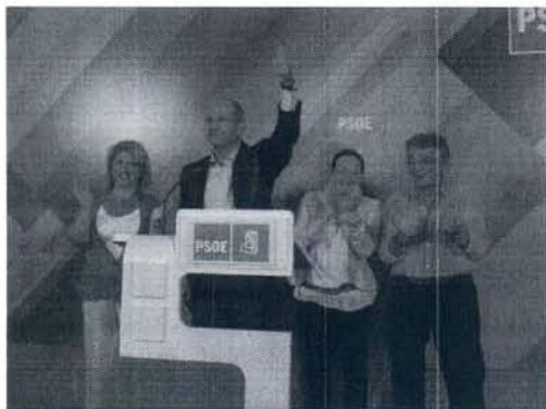
Publicado el 22-10-2011 14:18

El cabeza de lista al Congreso reitera los efectos positivos de la llegada de nuevos buques a la Base de Rota y asegura que está “plenamente dispuesto” a ofrecer al Ayuntamiento cualquier información adicional que precise