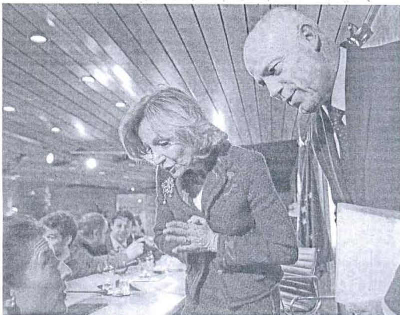
La ministra de Economía, Elena Salgado, y su número dos, José Manuel Campa, durante la presentación.

La revisión deja en agua de borrajas el escenario previsto en septiembre, que fue el empleado para elaborar los Presupuestos Generales del Estado de 2011. El Ejecutivo eleva en cinco décimas la previsión de paro para este año, que se situará en el 19,8%, mientras que sube un punto la de 2012, hasta el 18,5%. Estos nú-