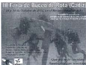
▼ Feria de Buceo.

La Feria se ubica en el Pabellón municipal del recinto ferial, pudiendo visitarse hoy hasta las diez de la noche, y el domingo desde las diez y media de la mañana a las cinco de la tarde.