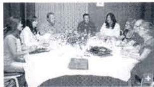
Dirigentes del PP y de Roteños Unidos, en una de sus reuniones de este verano para cerrar el pacto de gobierno.

El Partido Popular y Roteños Unidos (RRUU) sellarán mañana un nuevo acuerdo de gobierno que pondrá fin al divorcio entre ambos partidos que ha durado cuatro meses y, al mismo tiempo, dará estabilidad a un gobierno que viene gobernando en minoría desde el pasado 11 de junio.