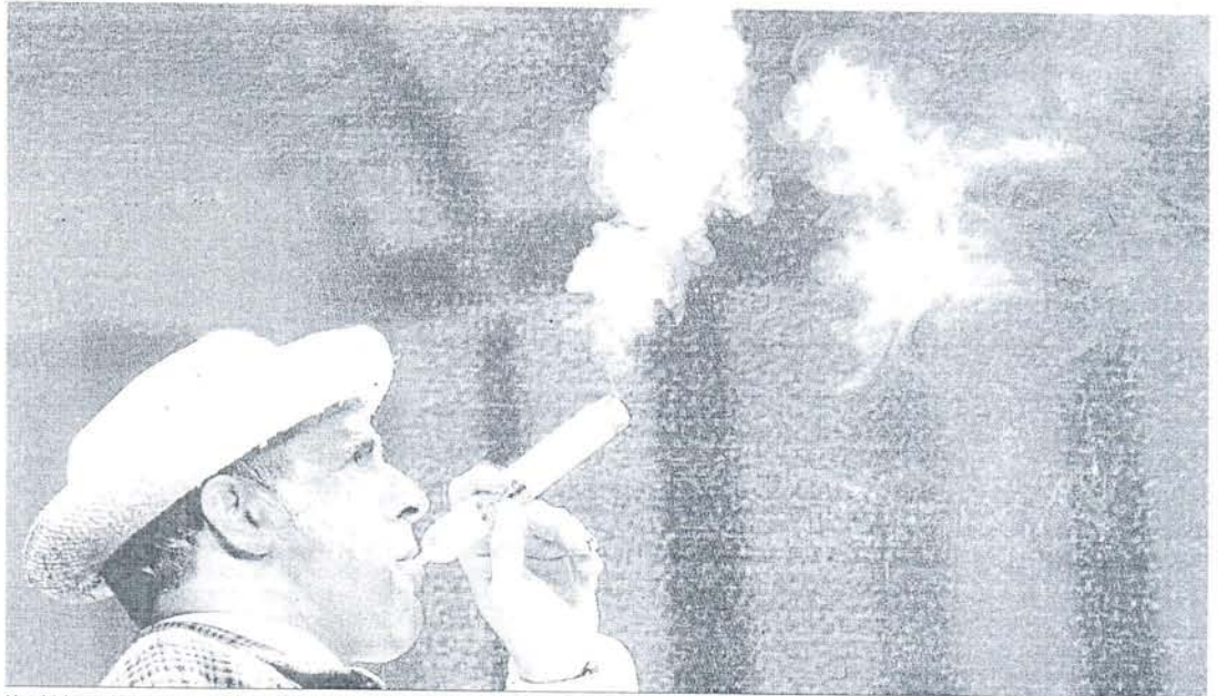
Un chirigotero 'fuma' en el escenario del Gran Teatro Falla durante la actuación de su grupo.

aseguraba ayer que todas las entidades asociadas están cumpliendo "escrupulosamente" la Ley desde el 1 de enero. Ahora bien, existe cierto temor a las noches grandes del Carnaval, en las que pueden producirse situaciones violentas. "Puede haber complicaciones porque son noches de alcohol y los encargados de las peñas pueden encontrarse indefensos si advierten a una persona que no puede fumar y ésta se niega. Es lo que pasa con esta Ley, que los hosteleros tienen que estar como policías y encima la multa recae sobre ellos", estimaba García. Por lo demás, García recor-