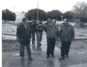
El acto será en el skate park.

El Ayuntamiento de Rota, desde sus Delegaciones de Participación Ciudadana, Fiestas y Limpieza, volverá a colaborar con la puesta en marcha de la tradicional fiesta de San Antón, patrón de los animales, que tendrá lugar este domingo día 30 en el polideportivo municipal Juan José Cañas.