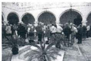
Los golfistas suecos.

Las cifras que baraja la agencia receptiva de golf sueca 'Playa Golf Tours', afincada en Rota desde mayo de 2009, revelan que el número de golfistas que desde octubre de 2010 hasta abril de 2011 va a traer a Rota la citada agencia, supondrán más de 18.000 pernoctaciones, la mayoría en Rota, y más de 12.000 Greenfees en los campos de Golf de la zona, pero sobre todo en el Costa Ballena Club de Golf.