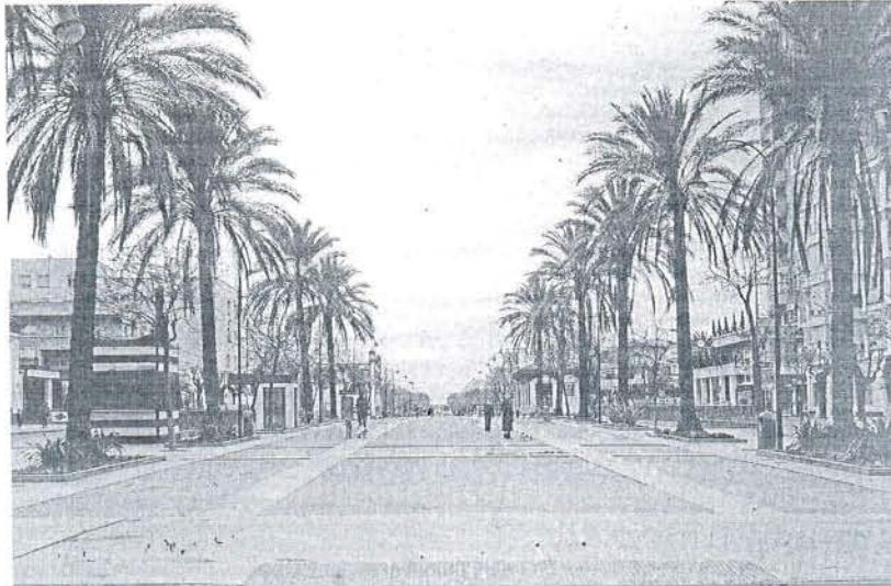
Una imagen del céntrico paseo de La Calzada de la Duquesa tomada ayer por la tarde.

De acuerdo con la versión del Gobierno local, "la instalación provisional de la Plaza en La Calzada o sus alrededores era una petición consensuada por todos los sectores afectados, que no quieren alejarla del centro de la ciudad ni que se demore más la ejecución de un proyecto tan necesario para Sanlúcar". Ahora que se ha determinado ubicar el Mercado en el propio paseo, "el Ayunta-