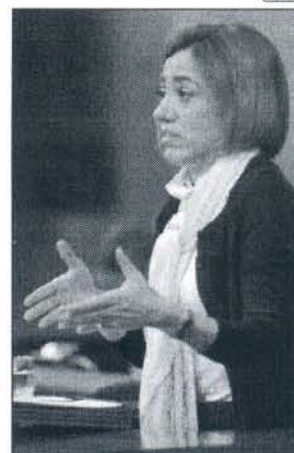
España anuncia las nuevas condiciones para vuelos y escalas de aviones de EE.UU.