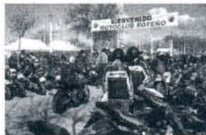
▼ La medida siempre funciona.

Se trata de una promoción que se suma al servicio de calidad que los hoteles ofrecen a la gran cantidad de visitantes y moteros que llegan a la ciudad para participar en la Concentración Motera 'Villa de Rota', que se celebrará el 5 y 6 de febrero.