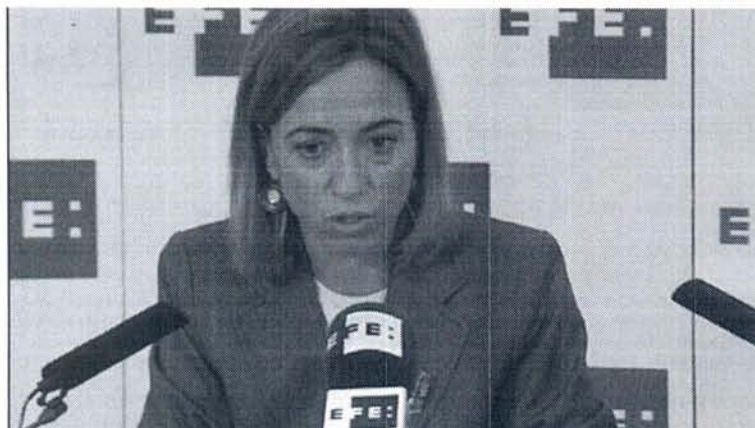
El lunes acaba oficialmente la misión de la OTAN en Libia y la ministra de Defensa ha hecho balance. Es necesario instalar Adobe Flash Player para poder ver este vídeo.

El repliegue total de tropas concluirá el próximo miércoles Chacón ha destacado "el trabajo bien hecho de los militares españoles" Las tropas británicas desplegadas en Libia también han empezado a regresar