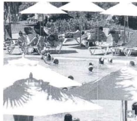
Uno de los establecimientos hoteleros de Chiclana, ciudad con el mejor índice turístico de la provincia.

Precisamente, según La Caixa, el pasado año fue el municipio Chiclanero el que mejor índice turístico tuvo de toda la provincia, con 1.138. Se da la circunstancia de que seis localidades