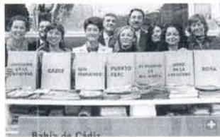
Los carteles de los siete municipios que conforman la Mancomunidad de la Bah a, juntos en una edici n de Fitur de hace varios a os.

0 comentarios 0 votos Me gusta 0 COMPARTIR