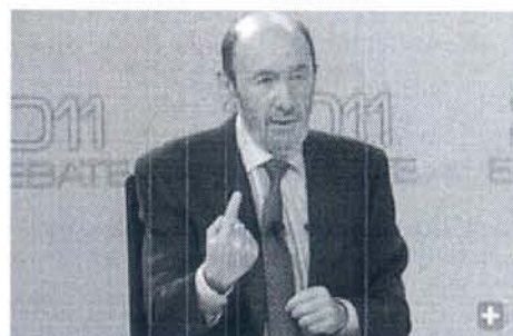
Rubalcaba habla en un momento del debate.