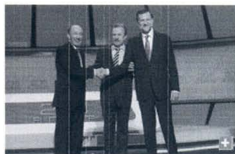
Alfredo Pérez Rubalcaba y Mariano Rajoy junto al moderador, Manuel Campo Vidal.

En el primer bloque del debate, el económico y el del desempleo , el más difícil a priori para Rubalcaba, Rajoy identificó a su contrincante con Zapatero. Y ante las acusaciones de éste sobre el programa oculto del PP, éste le espetó: "Yo no soy como usted", y Rajoy le relató todas las medidas de ajuste que el presidente del Gobierno ha tomado durante la crisis sin que estuvieran en el programa del PSOE, desde la subida del IVA a la rebaja del