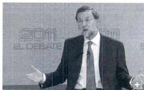
Mariano Rajoy toma la palabra.