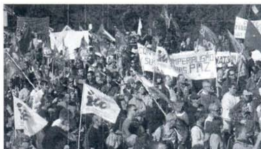
Asistentes a la Marcha a Rota, el pasado domingo.