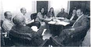
Encuentro de los portavoces.

La Junta de Portavoces celebraba esta semana un nuevo encuentro con la intención de estudiar y valorar de manera conjunta las Ordenanzas fiscales para el año 2012, que regulan los tributos municipales para el próximo año.