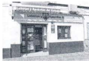
Administración nº 2 de Rota.

El número afortunado fue el 98.079, con un premio de 300.000 euros al billete. En la administración no se ha personado el afortunado ganador, pero sin duda habrá sido una alegría en momentos como los que vivimos en los que un premio como éste es más bienvenido que nunca.