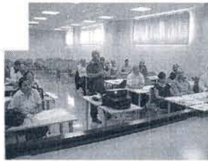
Asistieron ediles y técnicos.

El contenido del curso se ha centrado en la evolución de la Normativa desde la Ley de Protección Civil de 1985 y cómo esta afecta actualmente a las responsabilidades municipales, así como la revisión de lo contenido en el documento de actualización del Plan de Emergencia, para que su desarrollo se mantenga en constante revisión, y que se garantice una atención lo más eficaz y rápida ante las necesidades que exija cualquier emergencia que se de en la localidad.