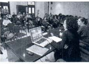
↑ Inauguración jornadas. - Autor: Información ↑ Este artículo dispone de 1 imagen adicional

Personal técnico del Ayuntamiento de Rota, y otras localidades de Cádiz, así como técnicos de empresas del ámbito de la planificación urbanística, participaban en la jornada sobre Urbanismo e Igualdad organizada por la Diputación Provincial de Cádiz, a través del Servicio de Igualdad de Género del Área de Igualdad, y con la colaboración del Ayuntamiento.