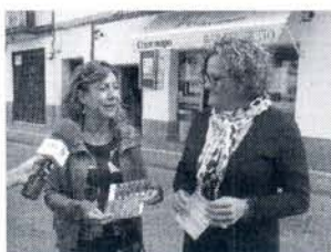
Presentación de la iniciativa.

A partir de hoy, cualquiera de nosotros puede ser un ilustre graduado en Tapeo Roteño. Y de la forma más sencilla: pasándose por cualquiera de los establecimientos participantes, y recogiendo una de las matriculas que debemos ir sellando al degustar las tapas de la original promoción que ha lanzado la Asociación de Empresarios, Industriales y Comerciantes de Rota (AECIRO).