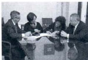
Firma del convenio de ALAT.

La Asociación Local de Ayuda al Toxicómano de Rota (ALAT) firmaba esta misma semana un acuerdo de colaboración dotado con una aportación de 8.700 euros con la que la Obra Social 'La Caixa' apoya el proyecto de 'Sensibilización y promoción del voluntariado' presentado por esta entidad roteña.