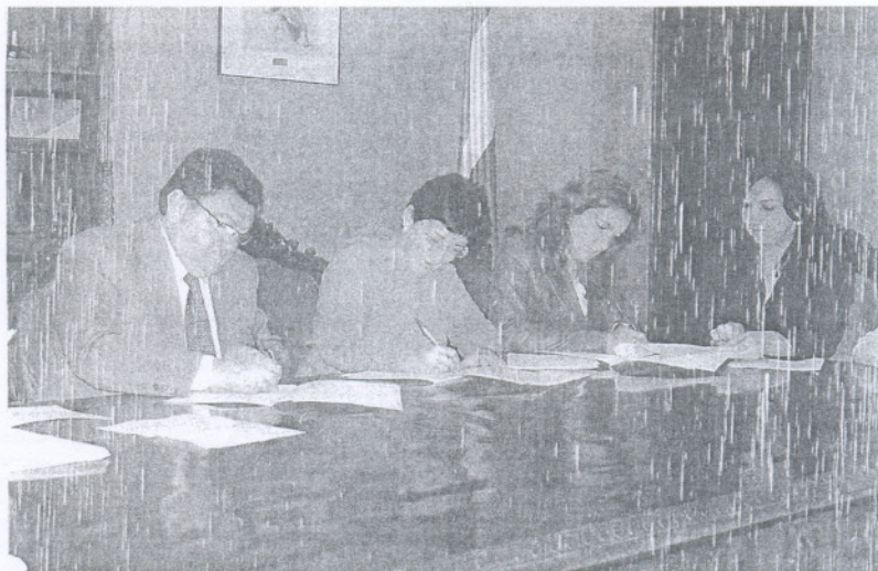
RÚBRICA. Momento de la firma entre el primer edil y las presidentas de las asociaciones.

la línea de colaboración que mantiene y ha mantenido el Ayuntamiento con numerosas asociaciones de la localidad, refiriéndose especialmente a las que llegan a prestar un servicio de ayuda «a personas con enfermedades como la diabetes, la fibromialgia, o la enfermedad celiaca, y que en ocasiones no alcanzan a ofrecer las administraciones que tienen las competencias».