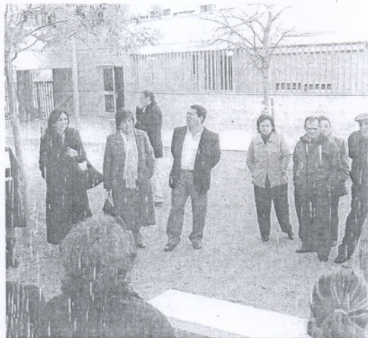
La delegada de Vivienda con los vecinos de los inmuebles.

Esta visita se producía tras las obras de mejora que la empresa municipal Aremsa ha ejecutado en estos bloques para solucionar