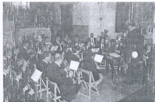
La Unión Musical Asidonense en un momento del concierto de fin de año.

Los 40 componentes de la agrupación, durante poco más de una hora, ofrecieron un amplio repertorio donde mezclaron villancicos propios de las fechas, con pasodo-