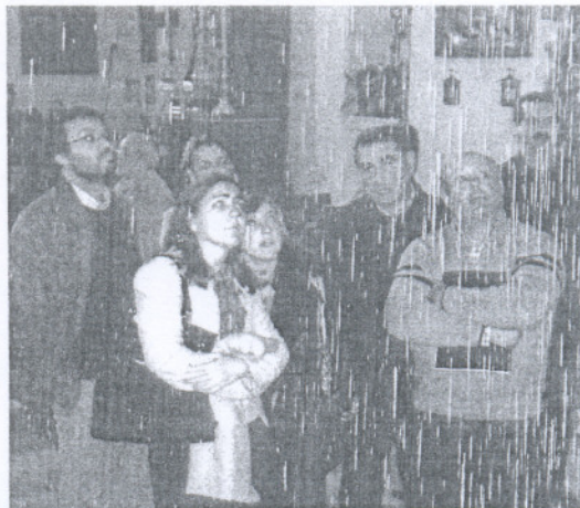
La delegada durante su visita de la pasada semana.

Por otro lado, el delegado de Fomento pidió a la Diputación