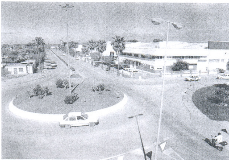
PROBLEMA. La zona en cuestión sufría constantes inundaciones con las lluvias.

«El equipo de Gobierno ha considerado que es más justo que los ciudadanos paguen este tipo de obras de gran envergadura a