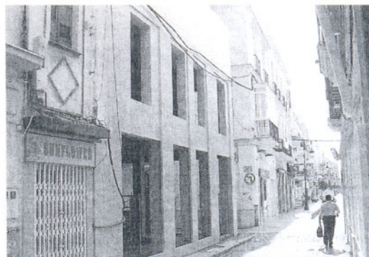
Aula Gerión ha denunciado, entre otros, la reforma de este edificio céntrico.

Ayuntamiento que "adopte las medidas urgentes necesarias e inste a la propiedad a eliminar de inmediato el actual acabado de las fachadas pertenecientes" al referido inmueble, que también ocupa la calle Santa Ana. Además, exige a la Administración local que "realice las correspondientes inspeccio-