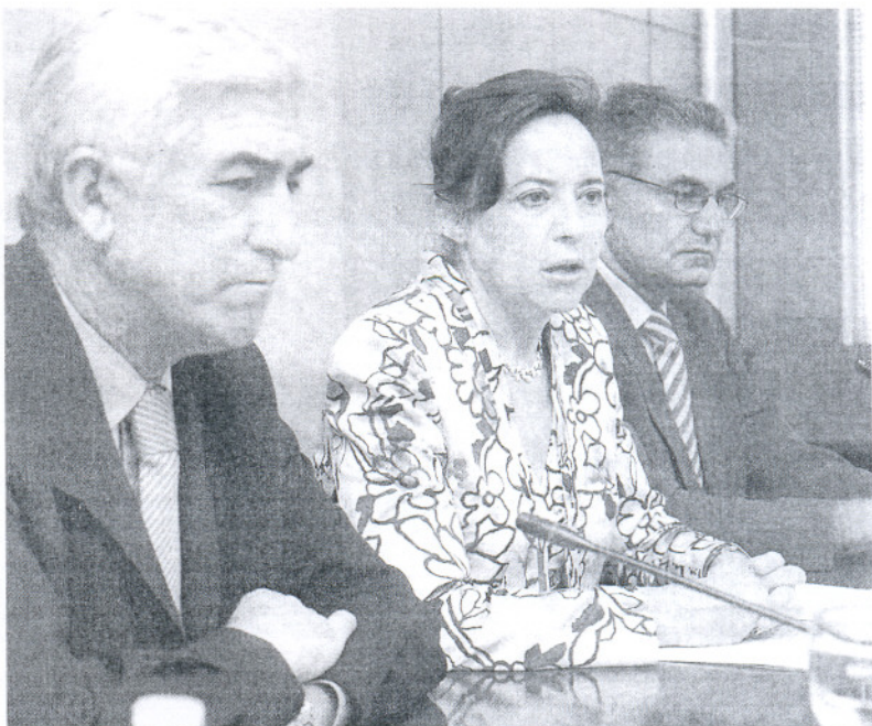
La consejera, entre el delegado del Gobierno andaluz y el de Obras Públicas, anunciando las mejoras en transportes.

Por su parte, la remodelación de la terminal marítima metropolitana de Cádiz supone una inversión de 1,75 millones de euros financiadas por el Consorcio de Transportes. Las obras, que tienen un plazo de ejecución de 12 meses y que no afectarán al servicio, con-