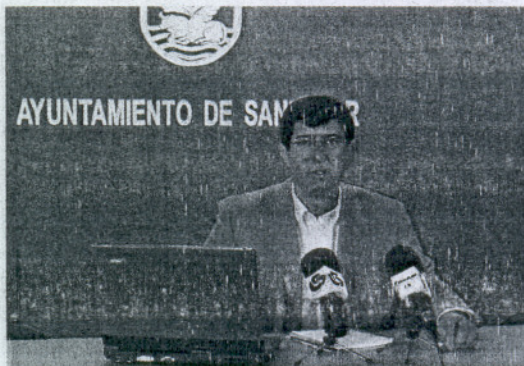
El delegado de Deportes anunció la nueva medida.

«Esta medida se lleva a cabo para responder a una de las