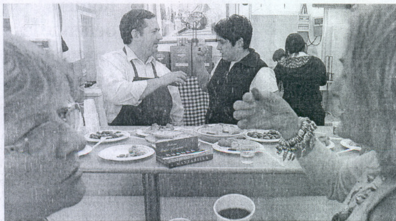
La Feria de la Tapa fue inaugurada en la tarde de ayer.