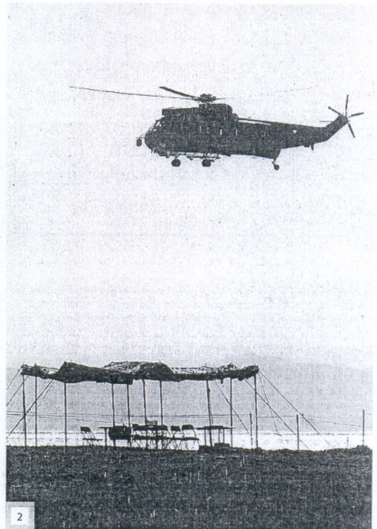
1. Un buceador enciende una bengala en la arena. 2. Un helicóptero sobrevuela la playa. 3. El Rey, en el 'Galicia', con altos cargos del Ejército y soldados. 4. Transportes ligeros despliegan una cortina de humo.