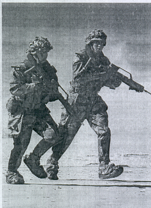
Dos soldados de Infantería de Marina durante el desembarco.

"En el operativo están todas las unidades que participarían en una incursión anfibia real, pero su tiempo se reduce para poder observar toda la preparación", explicaba el contraalmirante Santiago