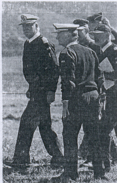
VISITA. Su Majestad junto a los mandos militares.

Su Majestad el Rey Don Juan Carlos asistió en la mañana de ayer en la playa del Campo de Adiestramiento Sierra del Retín a un ejercicio anfíbio de unidades de la flota y de la Brigada de Infantería de Marina, además, visitó el buque de asalto anfíbio Galicia . Las maniobras comenzaron pasadas las 12 de la mañana, el Rey llegó hasta la playa a bordo de un helicóptero y, con uniforme de capitán general de las Fuerzas Armadas, se acercó hasta el puesto de mando desde el que se iba a coordinar el ejercicio.