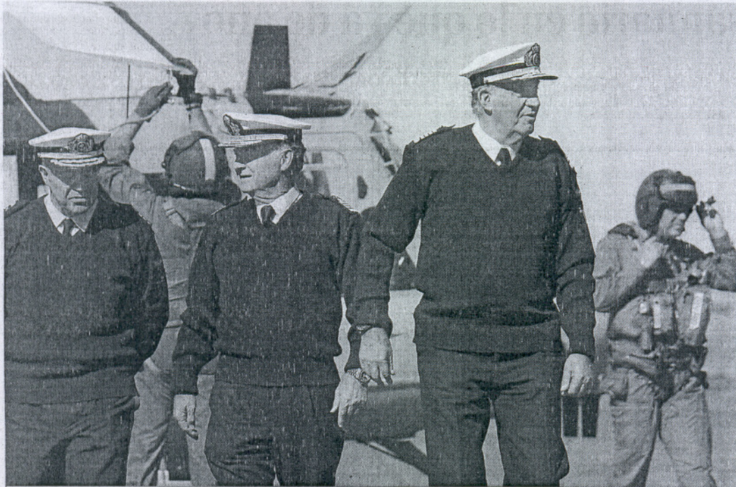
El Rey Don Juan Carlos llega en helicóptero a la playa barbateña acompañado por altos cargos de la Armada.

La Armada exhibe su potencial. Un millar de soldados y numerosas unidades de las Fuerzas Armadas ejecutaron ayer en la Sierra del Retín, en Barbate, una espectacular maniobra en tierra y mar para mostrar al Rey sus capacidades