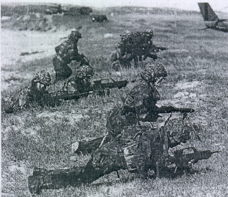
DESEMBARCO. Los soldados toman posiciones para asegurar el enclave en la playa.

TEXTO: PEDRO QUIRÓS / FOTOS: ROMÁN RÍOS / BARBATE