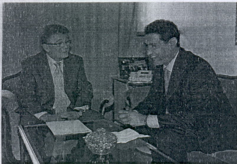
Ambos dirigentes trataron proyectos de futuro para la localidad chipionera.

En este último programa convergerán recursos del AEPSA, de los planes provinciales que gestiona Diputación, así como ayudas específicas procedentes de las áreas de Presidencia y Medio Ambiente de la institución provincial. El plan no sólo atenderá a las reformas viarias y de infraestructura