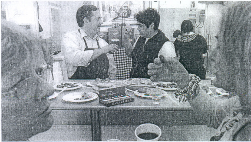
La Feria de la Tapa fue inaugurada en la tarde de ayer.