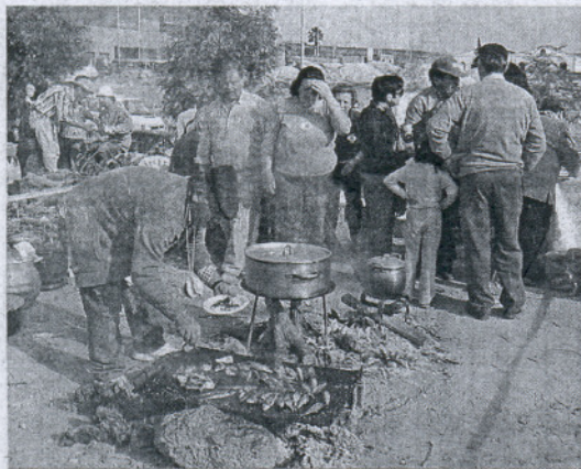
Este año volverán a repetirse escenas como éstas.