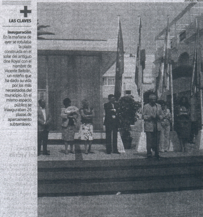
Ayer se inauguraron la plaza y las 26 plazas de aparcamiento en el solar del antiguo cine.

el levante", comentario que había escuchado de un antiguo profesor suyo cuando se refería a la provincia de Cádiz.