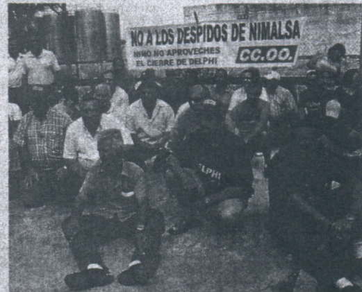
SENTADA. Concentración ante la empresa.