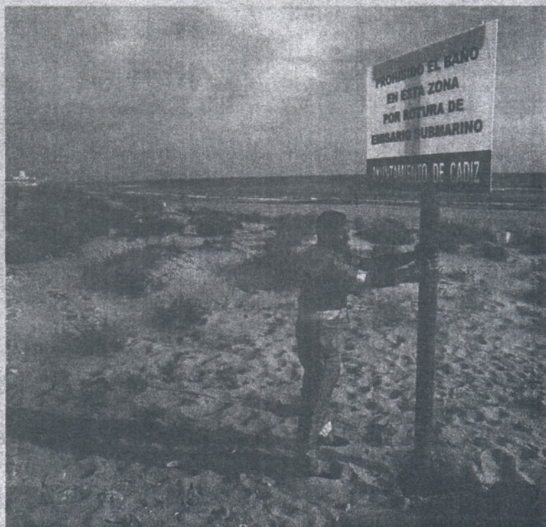
Un operario colocó en la tarde de ayer el cartel que prohíbe el baño en la playa de Santibáñez.