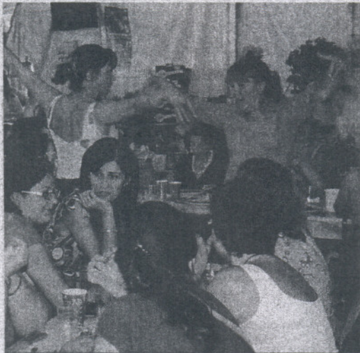
El baile, la comida y el vino se dieron cita en la Feria.

Ayer por la tarde se inauguró la zona destinada a las actividades