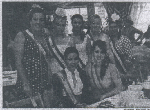
Las damas y la reina juvenil de la Feria.