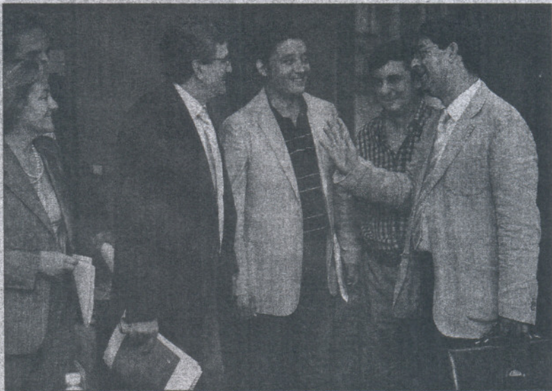
Delegaciones de PSOE e IU, ayer, en un hotel de Sevilla.

Ambos explicaron que han recordado a las agrupaciones loca-