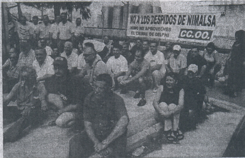
Los empleados despedidos de Nimalsa recibieron ayer el respaldo de numerosos trabajadores de El Puerto.

La protesta de ayer comenzó en las puertas de la factoría Nimalsa, donde como viene siendo habitual hubo una concentración inicial, a la que en esta ocasión se sumaron los comités de empresa de Delphi, del Ayuntamiento y de varias bodegas de El Puerto, además de la port-