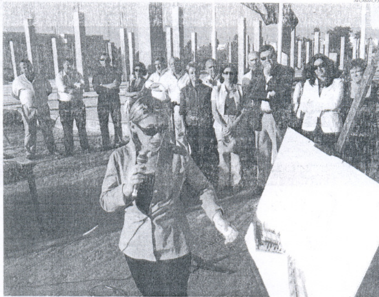
Asistieron el alcalde, miembros del equipo de Gobierno, así como por la plantilla y propietarios de la Sociedad Juviroi.

Igualmente, no se han olvidado las necesidades de las educadoras y por ejemplo todas las aulas, comunicadas entre sí, cuentan con la mitad superior de la pared de cristal para ofrecer una me-