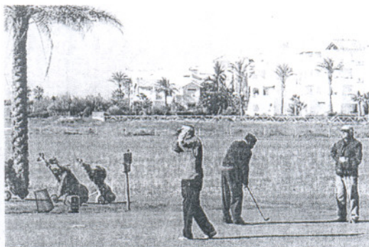
Jugadores de golf en el campo de Costa Ballena, en Rota.

Costa Ballena cuenta con tres hoteles operativos: el Colón Costa Ballena (Grupo Jale), el Playa Ballena (Hoteles Playa) y el Barceló Costa Ballena, que suman más de 750 habitaciones. La cadena Elba construye un cuarto alojamiento con 214 habitaciones y más de 20 millones de inversión que abrirá sus puertas a principios de 2008.