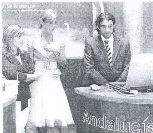
En el Patio de Columnas se expedió los que la solicitaron.

«Con el certificado electrónico se puede disponer de servicios de