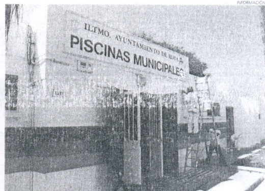
Los arreglos han sido ejecutados por la empresa municipal Aremsa.