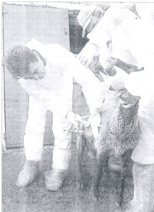
Dos veterinarios y un ganadero vacunan a una oveja contra la lengua azul .

Respecto a la lengua azul , el consejero de Agricultura y Pesca sostuvo que "en esta semana se está notando, a pesar del agua y del ca-