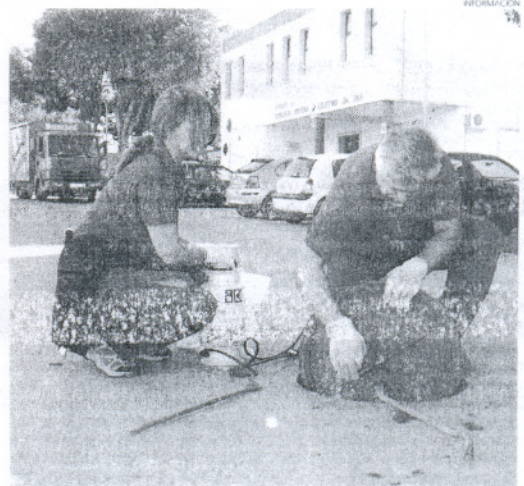
Operarios de la empresa Aplitec, empleando los productos desinfectantes.

Finalmente, desde el Ayuntamiento se solicita la colaboración de los vecinos para que no depositen la basura fuera de hora o fuera de los contenedores, ya que puede favorecer la aparición de insectos y roedores en la zona.