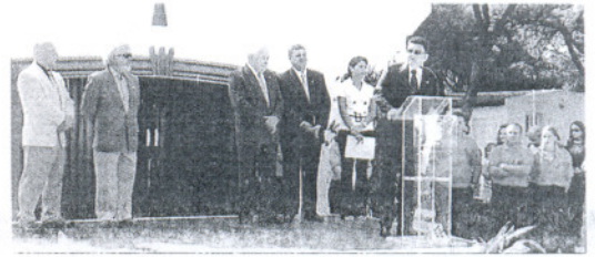
El homenaje se celebró en la nueva sede de Protección Civil.