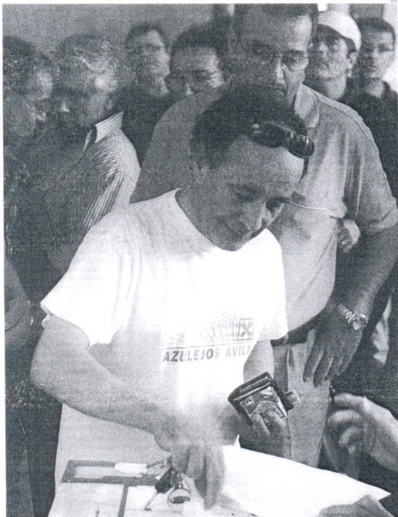
Las votaciones se prolongaron casi hasta las 13.00 horas de ayer en la planta.

millones de euros para indemnizaciones, así como la cesión a la Junta de Andalucía de todos los activos de la planta valorados en 170 millones de euros.