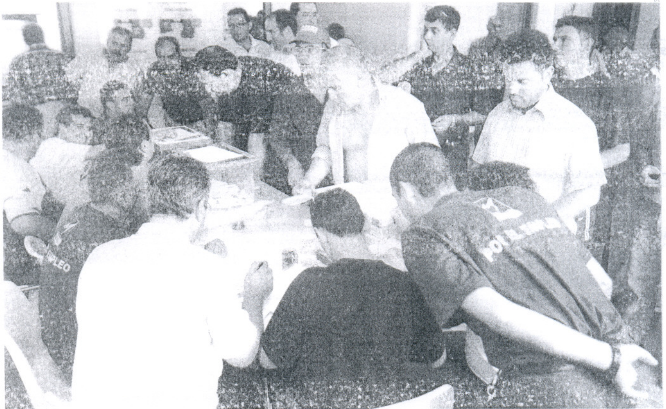
Los trabajadores de Delphi formaron largas colas, durante la mañana de ayer, para ejercer su derecho al voto en el referéndum sobre el acuerdo con Delphi.

Cuatro días después del acuerdo alcanzado entre Delphi y los sindicatos, los trabajadores han ratificado en referéndum el documento con un 89,4