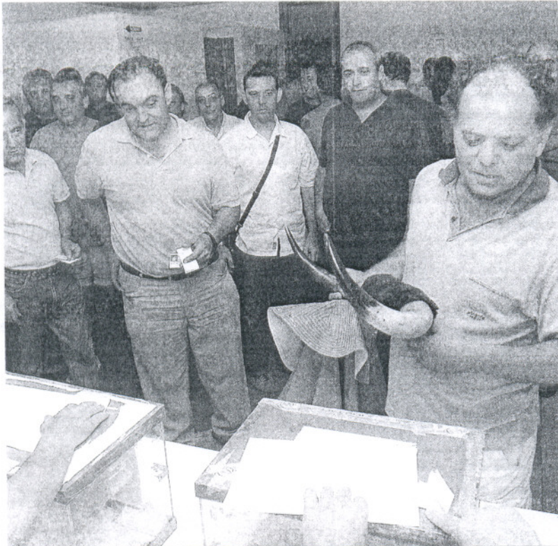
La participación fue numerosa y sorprendió positivamente incluso al comité de empresa.

Sindicatos y administración coinciden en que el cierre de la factoría pero reconocen que es el mejor acuerdo que podía firmarse