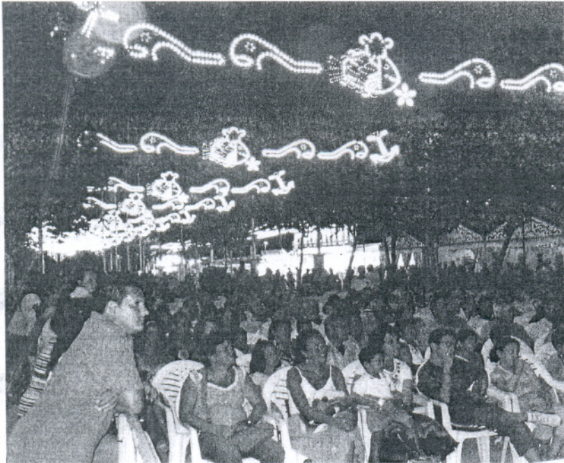
ANTES. La Fiesta de la Urta siempre se ha concentrado en su totalidad en un mismo sitio.