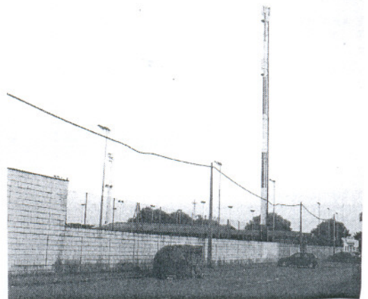
La instalación de antenas de telefonía móvil preocupa al Ayuntamiento.

La portavoz insistió finalmente en la preocupación del equipo de Gobierno, "hasta el punto de que hemos solicitado un informe que ponga en conocimiento del Ayuntamiento si la administración local tiene potestad para retirar algunas de las antenas que ya están colocadas que se piensan perjudiciales o inconvenientes para el bienestar de los ciudadanos".