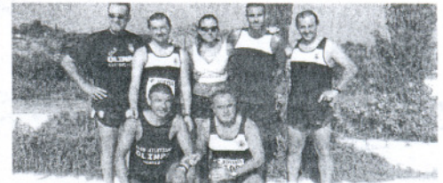
EQUIPO. Los atletas del Olimpo, tras la prueba.