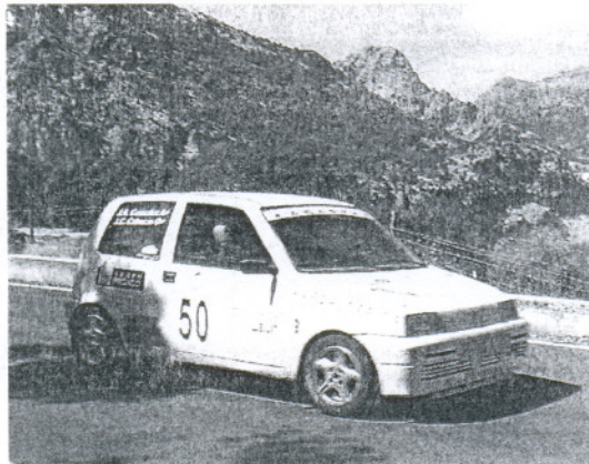
ENTORNO. La prueba transcurre por un paisaje único.

Durante este encuentro, se fueron desgranando todas las necesidades y requisitos para garantizar el éxito de una de las pruebas más queridas del panorama andaluz de la especialidad. Así, en la lista de prioridades ha estado la de encontrar ubicación al Parque cerrado, que finalmente se instalará frente al Cuartel de la Guardia Civil en una gran explanada que será acondicionada ex profeso en los próximos meses y dotada de luz y megafonía para dar presencia y prestigio a la salida del Rally. Las verificaciones administrativas se situarán, como en anteriores ediciones, en el edificio del campo de fútbol, donde los participantes recogerán sus documentaciones a primera hora de la tarde del viernes 28 de septiembre. Una vez colocada la publicidad y los números en el coche, piloto, copiloto y vehículo se dirigirán al centro mismo de la población donde tendrán lugar las Verifi-