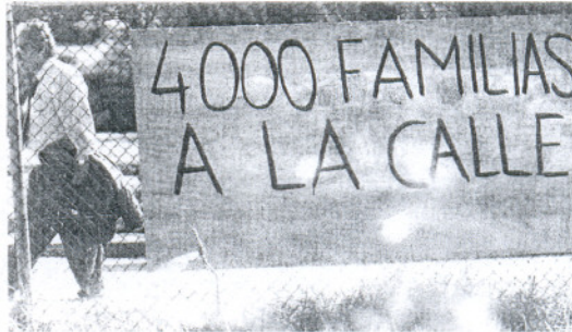
El colectivo mantiene esta reivindicación desde el principio. / I. B.

Con este argumento, un centenar de estos trabajadores protestó ayer ante la Delegación Provincial de Empleo, donde se leyó un manifiesto en el que estos operarios, la mayoría de producción pero también de mantenimiento, denunciaron que la Administración les ha «dejado en la estacada» al no incluirlos en el acuerdo de cierre y recolocaciones pactado con la multinacional. Según explicó Dávila, el plan industrial de 2005 contemplaba que la plantilla de Puerto Real se mantendría en los 1.600 empleos, de forma que aquellos puestos de trabajo que fueran desocupados por jubilaciones o bajas anticipadas serían cubiertos por personal eventual. Sin embargo, el portavoz de este colectivo asegura que el pacto con la compañía y el