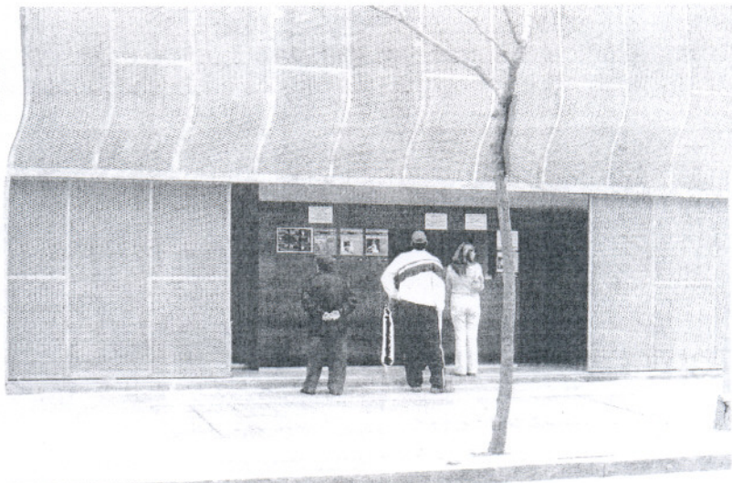
Durante el verano el nuevo auditorio Alcalde Felipe Benítez ha estado vacío de contenidos.

reto de que desde la Mancomunidad se empiece a coordinar una programación «que satisfaga, sino a todos, a la mayoría de municipios que la integran y que reporte beneficios económicos para todos». «La idea es iniciar reuniones con los representantes municipales y crear itinerarios de actuaciones que suponga un abaratamiento de los costes; faci-