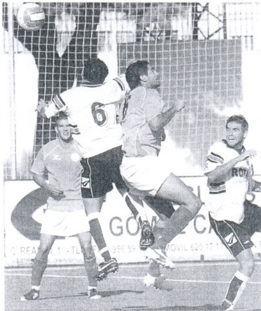
Balón aéreo en el choque entre isleños y roteños.

El partido estuvo dominado en gran parte del tiempo por un Sporting que llevó el peso de todo el encuentro. Los de Sanchis se hicieron los dueños del balón desde el principio con unos 20 primeros minutos de dominio total, en los