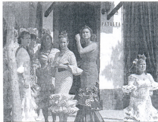
La Feria se llenó de mujeres vestidas de gitanas.

El concurso morfológico seguirá a las seis y luego habrá una corrida de toros. A las siete, se desarrollará la prueba de funcionalidad. 'Sueño Flamenco' animará el Real a partir de las ocho de la tarde, a las nueve se entregará premios y será la 'Carroza de Romería'. La orquesta Jacaranda pondrá música a la noche.