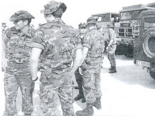
Soldados de uno de los convoyes que ayer llegó al cuartel de Camposoto.