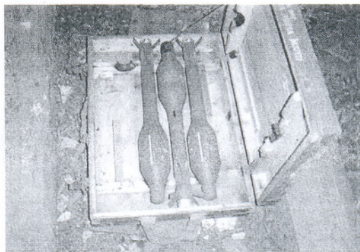
Algunas de las armas intervenidas por fuerzas multinacionales.

Las autoridades locales han sido informadas del hallazgo y, una vez que los equipos EOD del MNBN han comprobado la seguridad del armamento, se les ha transferido la responsabilidad de su custodia y transporte, con la ayuda de equipos de desactivado de las Fuerzas