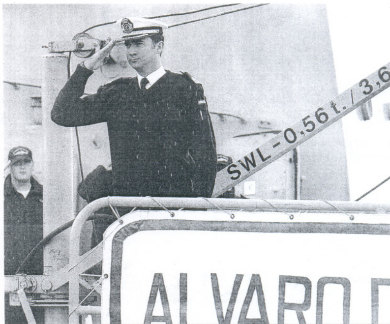
El Príncipe saluda a su entrada en la fragata 'Álvaro de Bazán'.