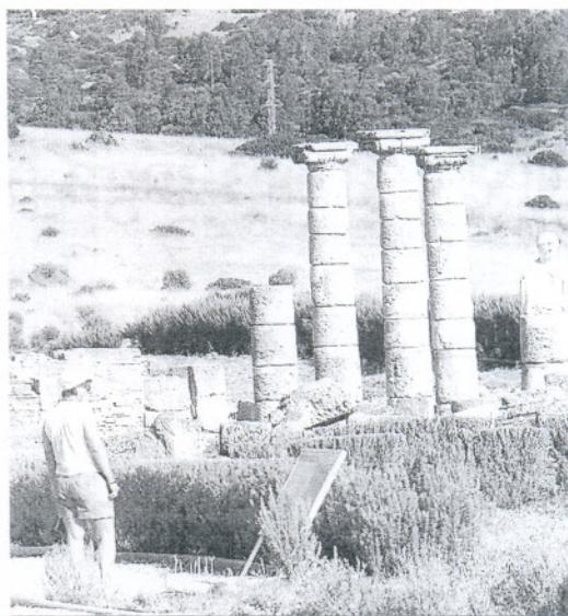
Una visitante recorre las ruinas de Baelo Claudia, en Tarifa.

La solución propuesta por la UCA se concreta en unos itinerarios, que se desglosan en diez temáticas y abarcan gran parte de la provincia. Algunos ejemplos de estas rutas son la del "Cádiz Prehistórico", conformado por los centros de interpretación de Benalup, El Bosque -que divulga la ruta arqueológica de la Sierra- y Puerto Serrano -dedicado a la necrópolis de Fuente de Ramos-; o la ruta "Cádiz Romano", a través del centro de atención al visitante de Baelo Claudia, en Tarifa, y el renovado museo arqueológico de Espera.