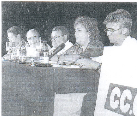
CCOO y Empiel durante la jornada informativa.

junta ha venido a reflejar lo que ha sido una constante desde finales de 2006, y es el perfecto entendimiento que ha existido entre la patronal y los sindicatos en todo el proceso de negociaciones.