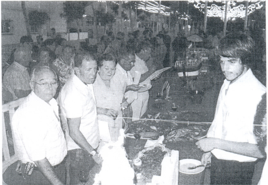
Fiestas ha diseñado un amplio programa de actividades y actuaciones de cara a la Fiesta de la Urta de este año.