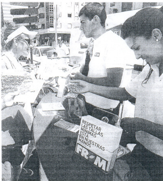
La mesa informativa se situó en la playa Victoria.

Esta unidad pasará el día de hoy en el centro comercial Carrefour de Bahía Sur, en San Fernando, y también estará presente en diferentes ciudades de la costa mediterránea, donde desde una unidad móvil situada en el Paseo Marítimo de cada una de ellas se facilitará información a los transeúntes, sobre esta campaña que finalizará el próximo día 31 de agosto en Valencia.