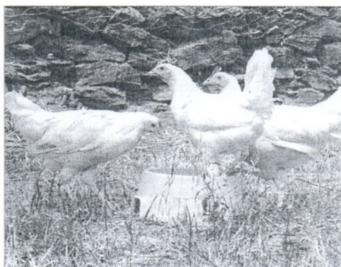
Gallinas en la granja granadina de El Cortijo del Cura.

En España ya hay 200 granjas que admiten a estos voluntarios, incluso con familias, por un mínimo de una semana. "Hemos heredado las granjas que ya estaban en la versión internacional. En el 80% son propiedad de extranjeros. Por eso se da el caso de familias de Estados Unidos que ven-