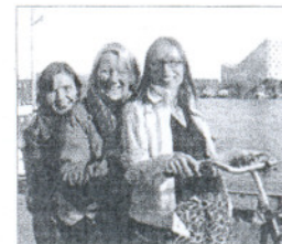
Las tres creadoras de la página.

FRANCIA: www.meetingthefrench.com DINAMARCA: dinewiththedanes.dk HOLANDA: dinewiththedutch.com