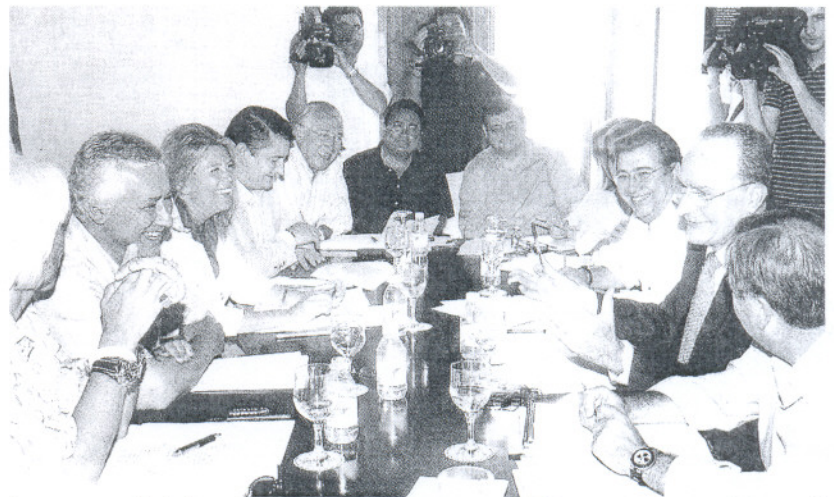
Arenas, ayer en Marbella, rodeado de los alcaldes y portavoces del PP en ayuntamientos andaluces

Se contempla, además, reclamar, previo examen por parte de una comisión mixta Junta-ayuntamiento, un calendario de pago de las deudas que mantiene el Gobierno andaluz con las corporaciones locales a consecuencia del impago de