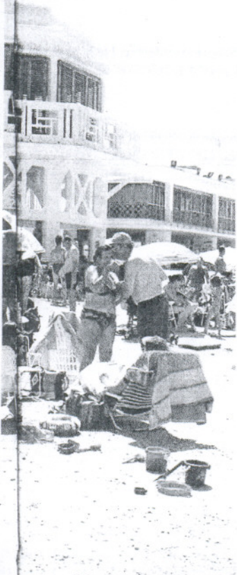
Las playas de Cádiz capital figuran entre las que más se han revalorizado

Con todo, aún está por cerrar el acuerdo al que tienen que llegar Ficosa y Alcor para desarrollar conjuntamente una estrategia. Las distintas posibilidades que barajan ya las adelantó ABC el pasado domingo. Una de las probables es que constituyan una sociedad conjunta donde Ficosa sea mayoritaria y Alcor sea el socio tecnológico. La decisión seguramente se tome en septiembre.