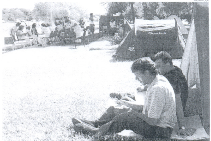
Los trabajadores de la contrata de limpieza, ayer acampados a las puertas de Delphi.