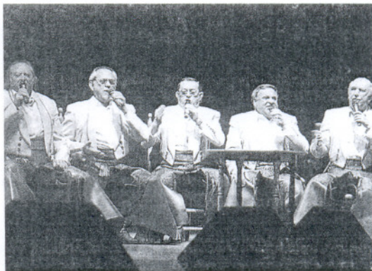
Los Romeros de la Puebla en una de sus actuaciones.

Paralelamente, y en función de los gustos de los más jóvenes, en el recinto ferial actuará los grupos locales Flexball y Hierbacana. Y es que en esta edición, en el escenario instalado en el recinto ferial, tendrán lugar actuaciones de grupos locales como Kaché, Palike, Abu Simbel, Los Robledos y el grupo gaditano De Cai, y en la céntrica plaza de La Merced se desarrollará la noche de carnaval con la actuación de 'La república gaditana', 'Los gladiadores de la Caleta' y 'Los Juan Palomez, yo me lo guiso