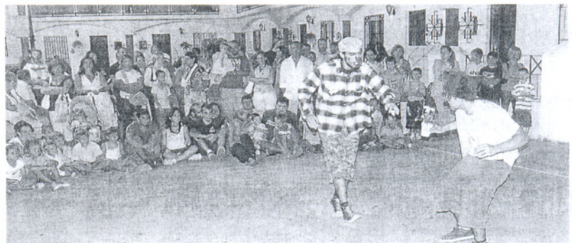
Los actores hicieron las delicias de todos los presentes

El programa Verano Joven ha ofrecido durante el mes de julio varias sesiones circenses, que se celebraron el 14, 15 y 29 de julio, y que al igual que ocurrió con las sesiones de este agosto, han conseguido congregarse a un impor-