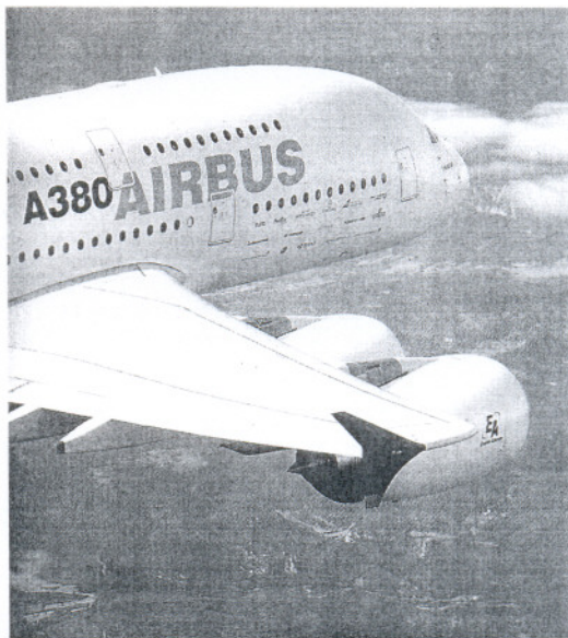
FINAL. El avión ha hecho vuelos de prueba por todo el mundo.

El superjumbo acumula hasta la fecha 173 pedidos para catorce clientes, entre encargos en firme y compromisos de compra. Las siguientes entregas para Singa-