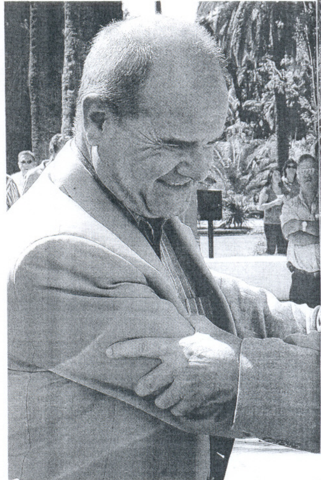
Manuel Chaves junto a Francisco de la Torre ayer en Málaga

Chaves aseguró que se hablará de inversión en la comunidad, de la «deuda histórica», de las transferencias de agua de Guadalquivir, y en general «de todos los asuntos que están en el debate diario de los partidos políticos, que afectan a la ciudadanía y que están en los medios de