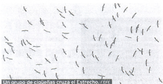
Un grupo de cigüeñas cruza el Estrecho.

La Consejería de Turismo promocionará Andalucía como uno de los destinos más completos para la práctica del turismo de naturaleza y, en concreto, para el avistamiento de aves, durante la British Birdwatching, que comenzará hoy en Rutland (Inglaterra).