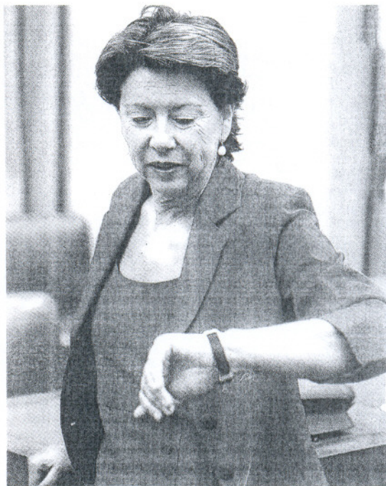
La ministra de Fomento en el Congreso el pasado martes