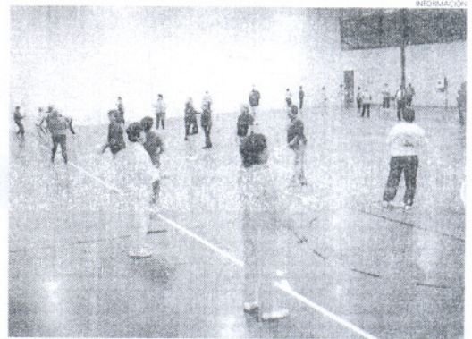
Los mayores de la localidad podrán de nuevo incorporarse a las clases.

El delegado ha querido pedir disculpas a los usuarios de estas clases por las molestias que haya producido el retraso que han supuesto los trámites de adjudicación del servicio