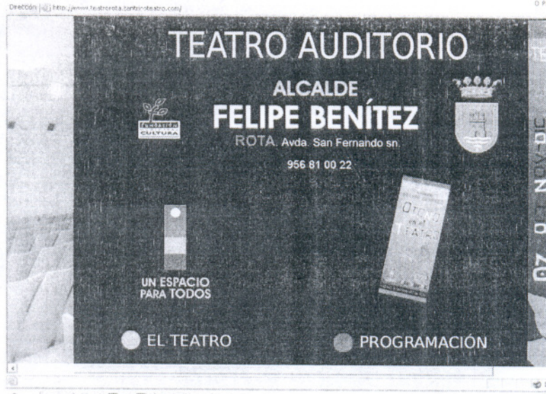
Imagen del inicio de la nueva página web del auditorio, desde donde se accede a la programación o al teatro.

Esta web informativa está fundamentalmente dividida en dos apartados principales: el primero de ellos, que irá cambiando cada trimestre, es el que alberga la programación del auditorio. El usuario puede pinchar con el ratón en la palabra interactiva programación, y este enlace le llevará di-