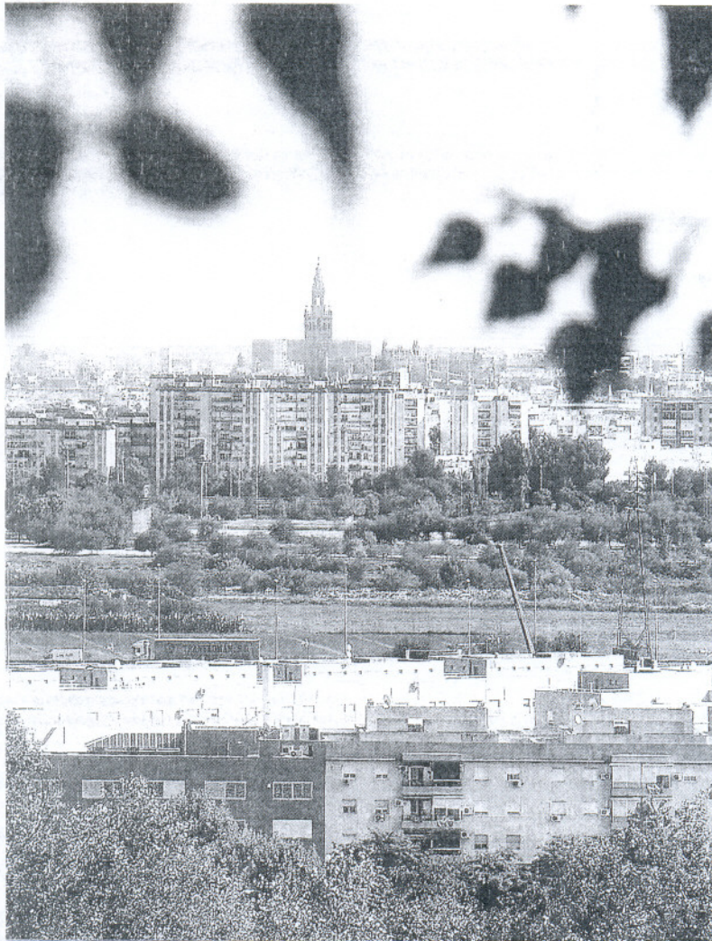
Promociones residenciales en el área metropolitana de Sevilla.

mente insatisfecho con la lectura que hace el Estatuto de este derecho. "No responde a las expectativas que se esperaban y no supone un avance respecto a las previsiones constitucionales; tampoco introduce novedad alguna con respecto a la situación existente", dice Chamizo. El anteproyecto de la Junta tampoco va mucho más allá, limitándose en realidad a una vaga promesa de impulsar las VPO sin mayores responsabilidades jurídicas. Frente a esta postura, el Defensor reclama que, mediante la citada ley parlamentaria "se arbitre legalmente la posibilidad de exigir este derecho ante los tribunales de Justicia". Chamizo sugiere incluso tres supuestos diferentes —en función de grupos concretos de población— para regular la aplicación de tal derecho, así como las obligaciones que tendrían las instituciones. Y algo más: recla-