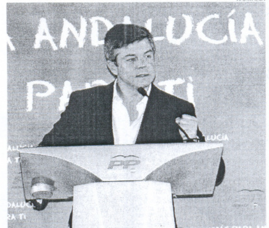
El fiscal pide para el alcalde de La Línea dos años de inhabilitación.

miento de La Línea un plazo de 20 días para abonar la cantidad adeudada de 1.038.028 de euros, más el interés legal del dinero incrementado en dos puntos y se requirió personalmente al alcalde linense que diese cumplimiento a dicha obligación, bajo el apercibimiento de multas coercitivas y de deducción de testimonio de particulares para exigir responsabilidades penales. La Fiscalía indicó en su escrito que el alcalde, "pese a tener perfecto conocimiento de su obligación de cumplir con las resoluciones mencionadas, no dio cumplimiento a los dictados judiciales.