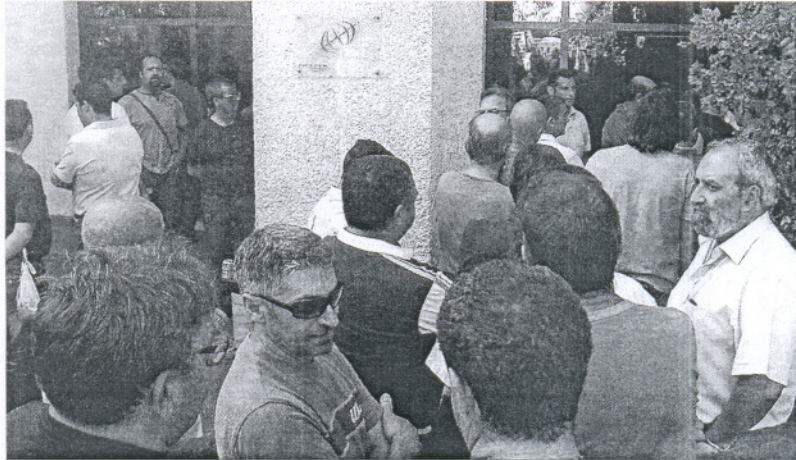
La plantilla de Delphi en Puerto Real esperará a conocer su futuro hasta después del verano.

Las partes comienzan hoy a reunirse para determinar los planes de formación o prejubilaciones, que tendrán que estar definidos en octubre