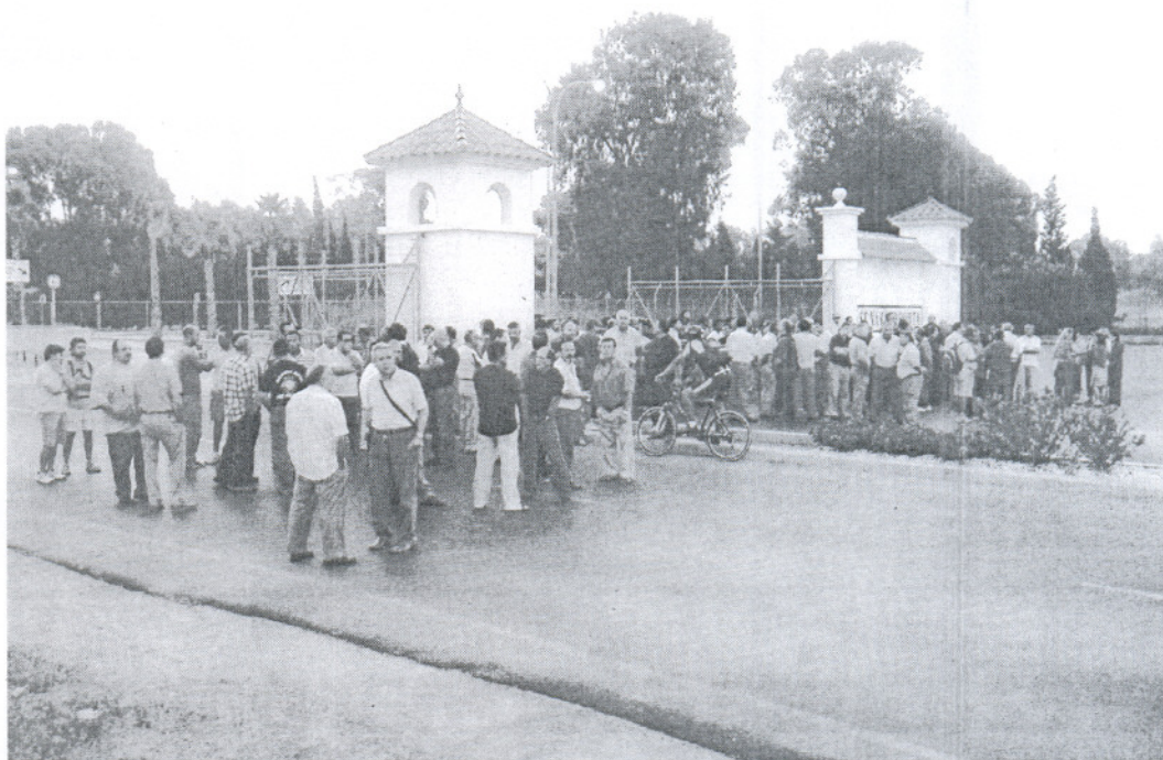
Los trabajadores taponaron el acceso al recinto militar desde las 7.00 horas hasta las 08.30 horas.

Otro de los problemas sobre el que se pretende llamar la atención con la protesta es la vigencia del actual convenio colectivo, que