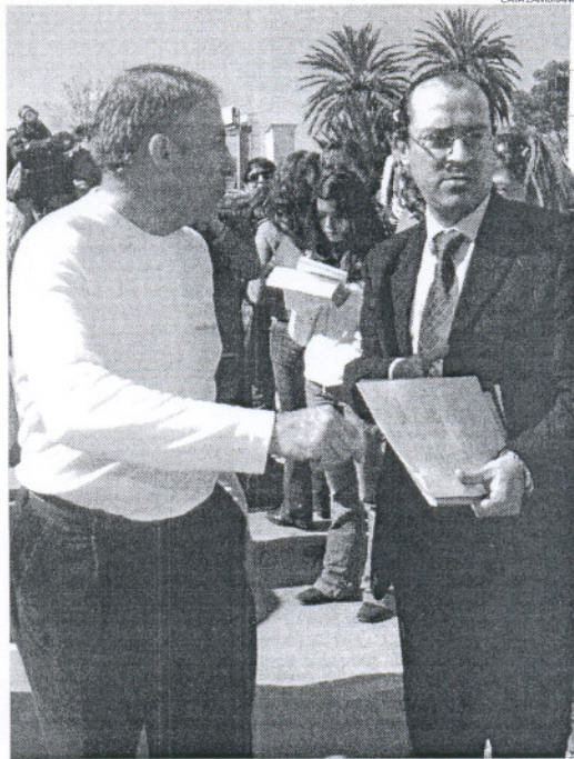
El comité estudiará con la Junta las medidas a adoptar tras el acuerdo.