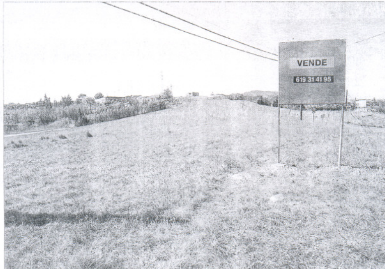
Parcela en venta en Alhaurín de la Torre (Málaga).