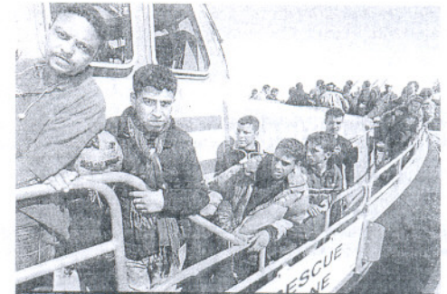
INTERCEPTADOS. Los inmigrantes, a su llegada a puerto.