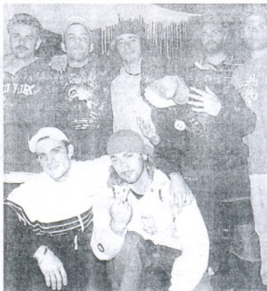
GRUPO. Integrantes de Agrezi3n Manada.