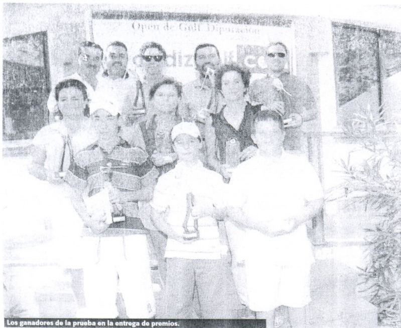
Los ganadores de la prueba en la entrega de premios.