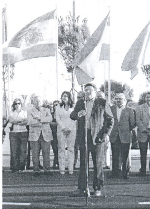
La nueva avenida da acceso a las 458 viviendas de protección pública.

Posteriormente y entre aplausos, se procedió al alumbrado público de la zona y la vía quedó abierta al tráfico. Pero el acto no concluyó con este gesto. El alcalde junto a sus compañeros de Gobierno y Corporación, invitados y asistentes dieron un paseo por las inmediaciones. Durante el recorrido todos pudieron contemplar las nuevas casas que darán cabida a 458 familias roteñas.