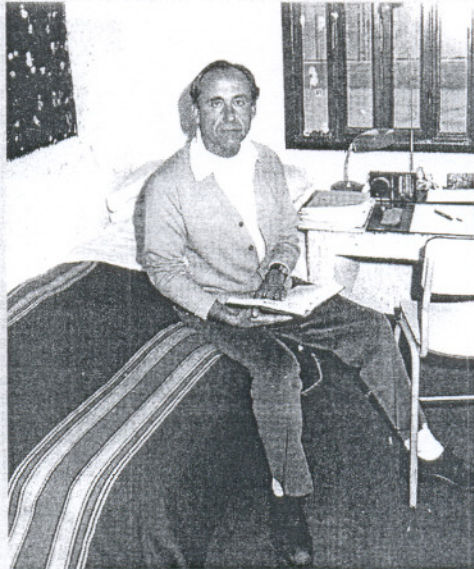
EN PRISIÓN. Estuvo en la cárcel en 12 ocasiones distintas.