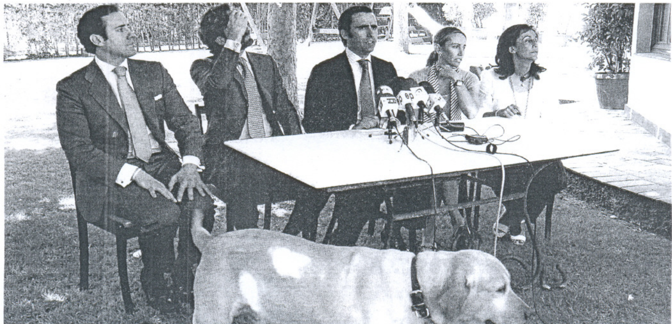
ILEGALIDAD. Cinco de los trece hijos del empresario comparecieron y criticaron que el juez no haya permitido un aplazamiento o que un forense emitiera un dictamen.

Para pedir su liberación, la familia de Ruiz-Mateos alega, además de su edad, una sentencia del TC que establece que cuando una persona ha pasado por la cárcel y, posteriormente, se le declara inocente, en la próxima condena debe ser compensado por ello y ser redimido antes de ingresar en prisión.