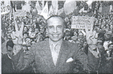
APOYOS. Concentración en Jerez, en 1997.