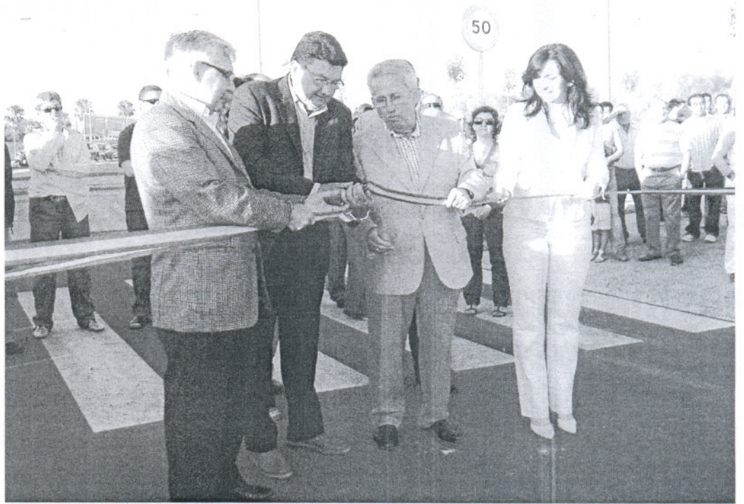
El alcalde, la primera teniente de alcalde y miembros del equipo de la Corporación asistieron al acto inaugural.