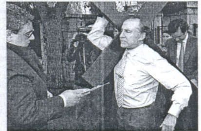
MEDIÁTICO. Así recibió una citación en 1996.