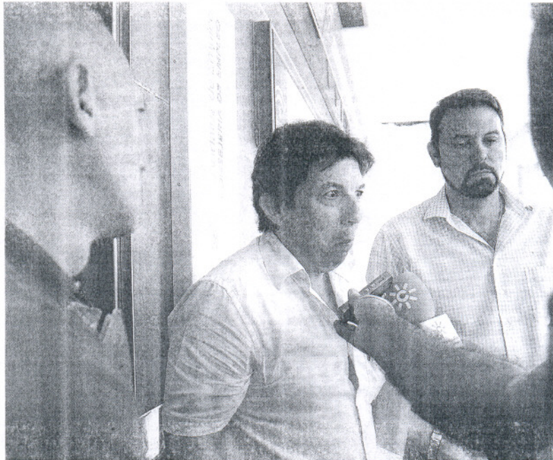
Un ex empleado de la factoría puertorrealeña atiende a los periodistas en el Servicio Andaluz de Empleo de Jerez.