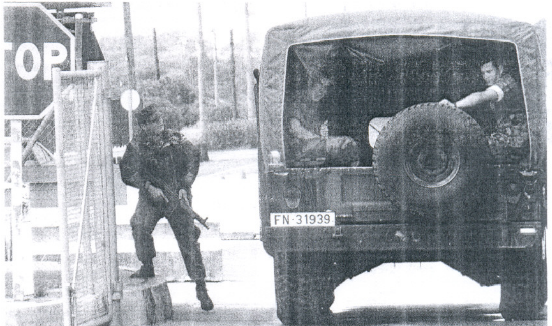
Control de acceso a la Base de Rota, municipio con la mayor servidumbre de Cádiz (un 23,5% de su término) y al que no le han pagado aún la ayuda del 2007.

EL REGIDOR BARBATEÑO, ACORRALADO POR LAS DEUDAS