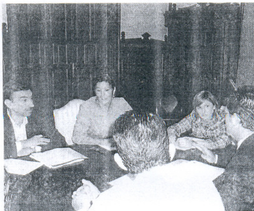
Los pescadores se reunieron con la directora de Pesca de la Junta