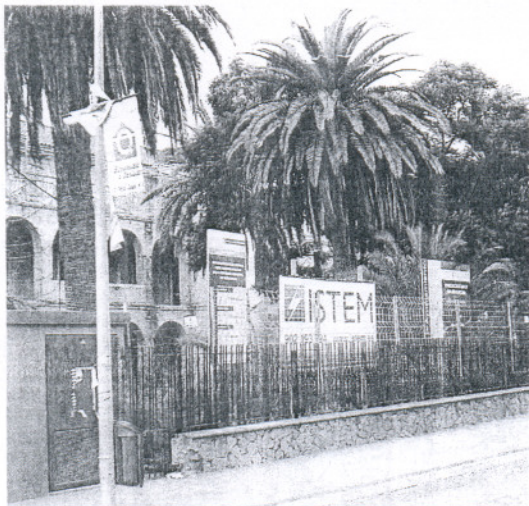
La segunda residencia está proyectada en el antiguo asilo.