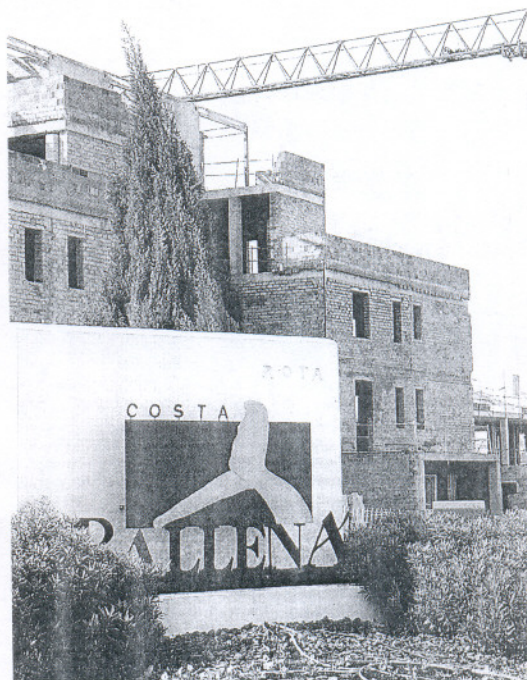
El Gobierno andaluz se encargó del deslinde hace 15 años. / J. G.

Sánchez Alonso aclaró que desde Rota «ni hemos usurpado nada, ni le hemos quitado nada a nadie», y recordó que hace más de quince años la Junta de Andalucía estableció los límites de cada población dentro del proyecto turístico. «De modo que deberá ser el Gobierno autonómico, responsable en aquel momento del planeamiento de ese suelo, el que se pronuncie y ofrezca una explicación, ya que ese sentimiento de reivindicación no ha aparecido en todo este tiempo».