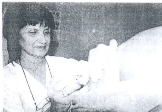
Una enfermera suministra la vacuna a una paciente.

La vacunación es la principal estrategia para la prevención de la gripe, ya que permite evitar en torno a un 60% de hospitalizaciones y el 80% de fallecimientos por complicaciones tras la enfermedad. La campaña de vacunación se inicia todos los años durante el mes de octubre y finaliza en noviembre para ofrecer una adecuada protección contra la gripe en su período de mayor incidencia, entre noviembre y febrero. Salud aconseja acudir de forma escalonada a alguno de los 126 puntos de atención que existen en la provincia.