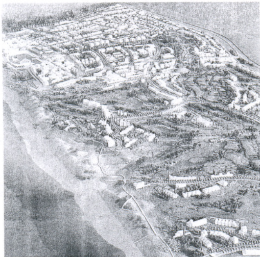
Maqueta de Costa Ballena, que hoy está construida sólo hasta la mitad.