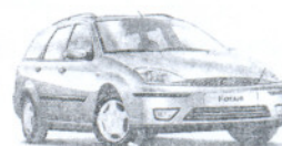
Ford Focus Wagon