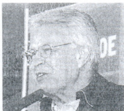
Felipe González EX PRESIDENTE DEL GOBIERNO