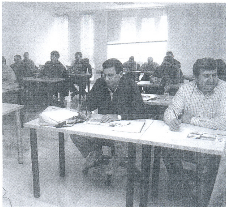
Ex trabajadores de la plantilla de Delphi, en uno de los cursos de formación en Puerto Real.