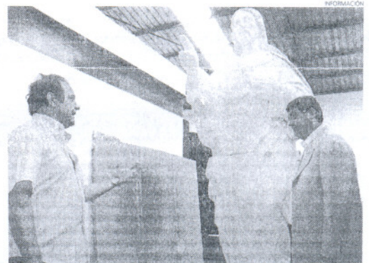
Imagen de archivo en la que se aprecia el estado de deterioro que sufría.

contraba aún más deteriorada, debido a la erosión del tiempo, el viento y el mar, ya que presentaba importantes grietas, había perdido trozos del manto, de la manga, o del pelo, y la peana estaba casi destrozada. La imagen, a la que se le han aplicado varias capas de protección para resguardarla por más años, se volvió a colocar el 25 de noviembre en la plaza Pío XII.