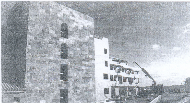
HOTEL. La cadena hotelera quiere abrir las puertas de su nuevo hotel en el mes de marzo. / O. C.

El nuevo hotel tendrá 214 habitaciones dobles de 30 metros cuadrados, 21 junior suites y una suite de 40 metros cuadrados, todas con terraza o balcón privado con