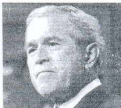
George Bush PRESIDENTE DE ESTADOS UNIDOS

La agencia de detectives contratada por la familia McCann asegura que la niña podría estar en casa para Navidades, pero no aclaran dónde está ahora.