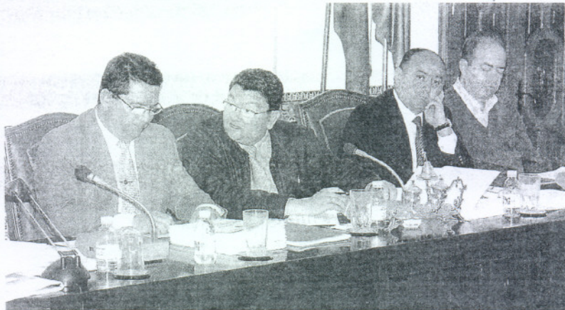
APROBADA. La Junta de Gobierno Local dio luz verde a la propuesta.

Norte como «uno de los proyectos más importantes y emblemáticos de esta legislatura, ya que en esta nueva avenida se contemplan cinco viales que permitirán una comunicación directa desde la entrada al municipio hasta las playas». Según la delegada, el Viario Norte servirá para distinguir el suelo no programado y del programado, «haciendo posible no sólo a creación del polígono industrial R1 previsto en el primer vial, sino también de nuevas viviendas de protección pública».