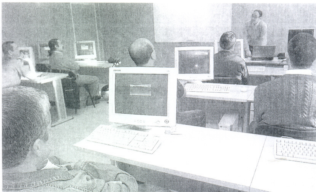
Ex empleados de la factoría de Delphi, en los cursos de formación.