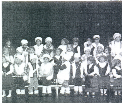
Los pequeños pastorcillos cantaron sus alabanzas al Niño Jesús.

Así, al escenario del auditorio Alcalde Felipe Benítez subió para deleitar a los presentes con sus villancicos un grupo de 50 alumnos de primer y segundo curso de