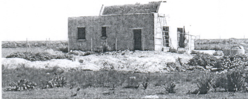
Una de las construcciones que se levantan sobre una cañada en el término municipal portuense.