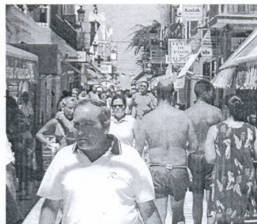
La ocupación puede llegar al 86,91% en la segunda quincena de julio.

En lo que respecta a la segunda quincena de julio, Horeca estima que la ocupación sea del 86,91%, un 2,75% más que la primera, que alcanzó el 84,16%. En esta ocasión será Chiclana la que obtenga un mayor porcentaje con el 96,32%, mientras que Cádiz llegará al 92,91%; Tarifa al 92,21% o Conil al 89,49%. De nuevo Arcos tendrá la menor ocupación, tan sólo un 51,48%.