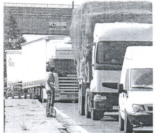
Un agente de la Guardia Civil inspecciona la zona del segundo accidente y vigila las largas colas de vehículos.

«Esta legislatura debe ser la legislatura del consenso y el diálogo que, por encima de intereses partidistas, hagan posible acuerdos».