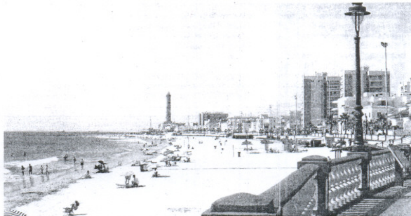
La chipionera playa de Virgen de Regia es una de las más concurridas.

«Frente a estos resultados negativos, en el apartado de oportunidades y fortalezas se refleja la unión existente entre todos los empresarios del sector». Una realidad a la que Athos responde «conociendo el potencial de recursos naturales de que disponemos y sabiendo que son todos valores turísticos en alza, así que seguiremos trabajando para crear la marca Chipiona alzando en ella todos los valores ecológicos, culturales, de tradición e identidad que nuestro pueblo posee».