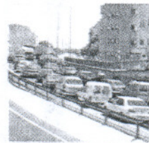
Retenciones en Tres Caminos.