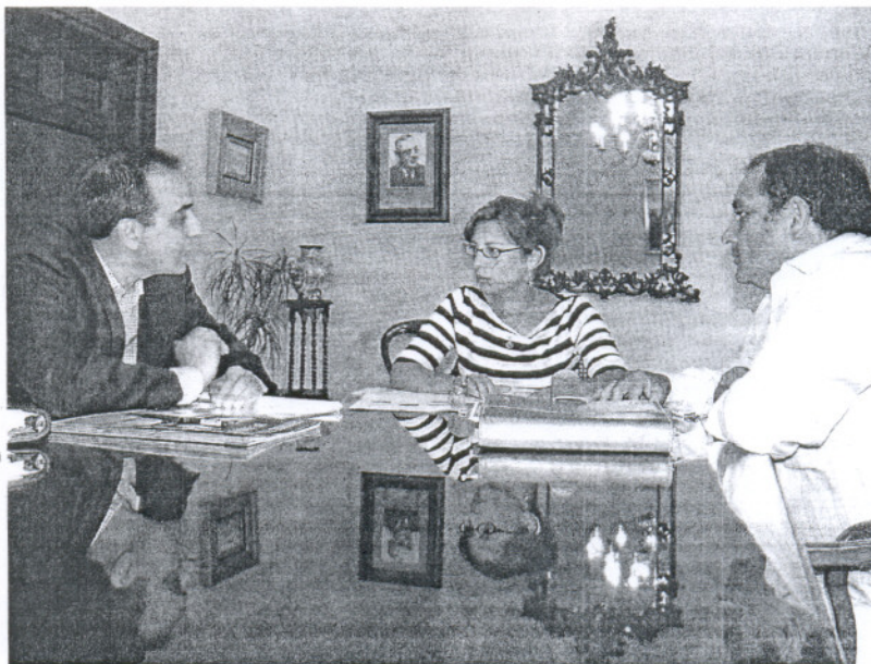
La edil de Roteños Unidos atendió la propuesta de los representantes de la asociación.