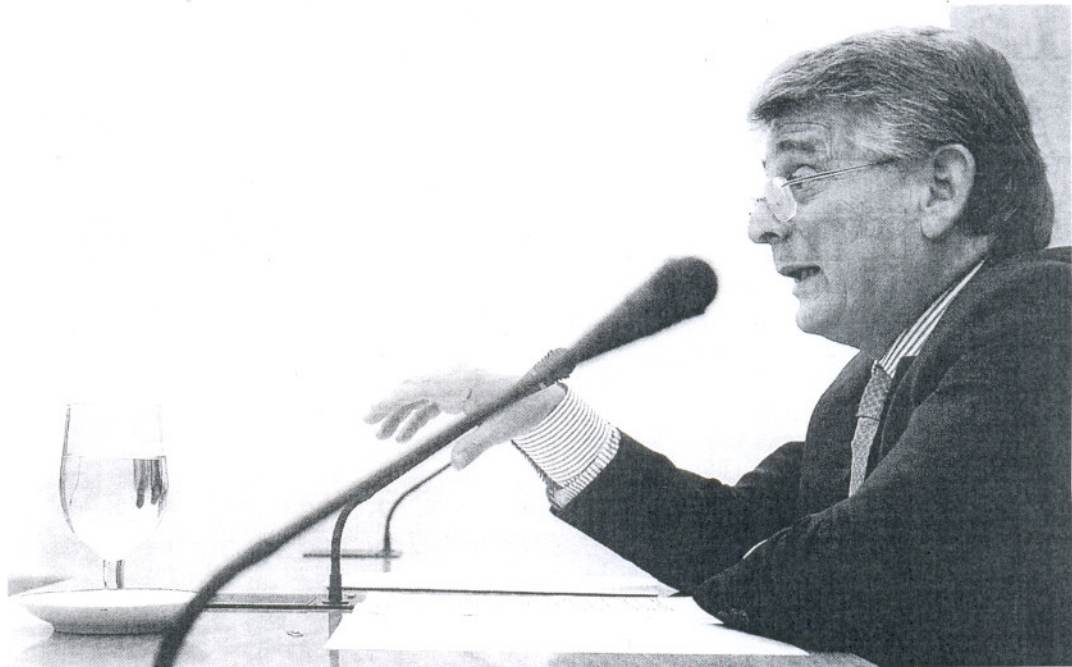
El presidente de la Diputación, Francisco González Cabaña, mientras anunciaba el nuevo equipo de gobierno de la institución que dirige.

Francisco Menacho, vicepresidente tercero, también tendrá la ayuda del concejal jerezano Juan Manuel García Bermúdez. El área económica de Diputación con el servicio de recaudación o la ejecución de presupuestos serán su cometido, además de la conser-