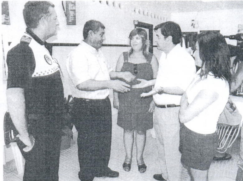
El delegado de Playas agradece su trabajo a los técnicos municipales y a la Policía Local.

En los casos de las playas del Chorrillo, el Rompidillo y Piedras Gordas, las tres han sido merecedoras de la certificación ISO 9001 y 14001. Se trata, en palabras del delegado de Playas, de certificaciones muy difíciles de conseguir y que sólo se logran a través del trabajo. La Q de calidad la concede la Dirección General de Turismo junto con empresarios privados; la ISO 9001 y la ISO 14001 destacan el nivel de gestión medioambiental; y la EMAS es la máxima distinción de calidad que