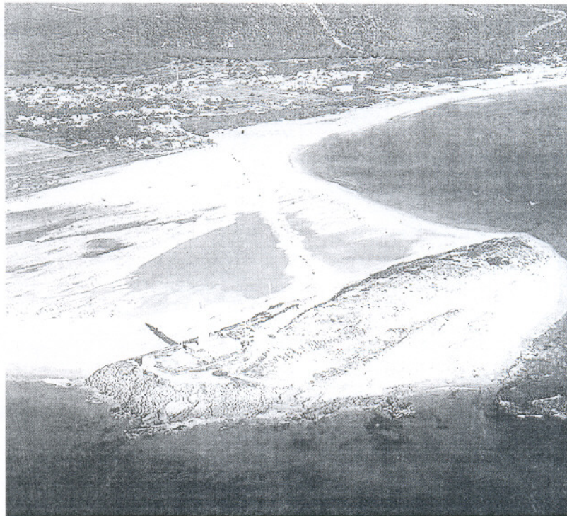
Vista aérea de la costa de la Janda, con el faro de Trafalgar, en Barbate, delante, frente al que se proyecta el parque eólico.

El Real Decreto establece que los parques marinos tendrán una potencia mínima superior a los 50 megavatios. No obstante, el Ministerio de Industria podrá modificar, hasta en un 20 por ciento al