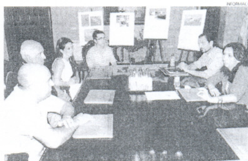
Los andalucistas se reunieron con la primera teniente de alcalde.