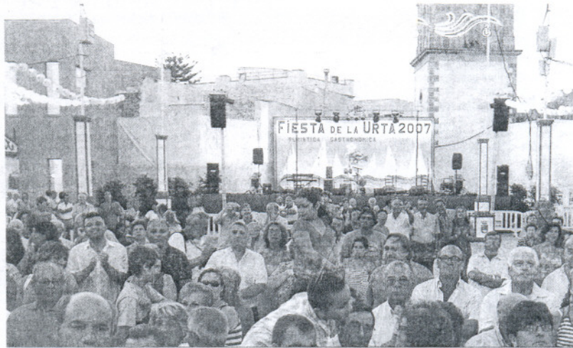
Muchos roteños se acercaron a la nueva ubicación de la Feria de la Urta, la plaza de la Merced.

Posteriormente, y tras un pequeño paseillo por parte de los miembros de la Corporación por