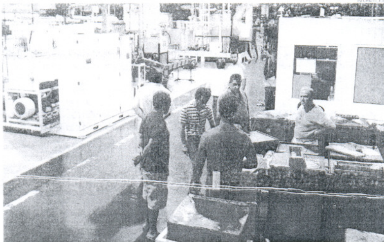
Tras recibir los cheques bancarios, los antiguos trabajadores de Delphi podrán inscribirse desde hoy en el paro.

Así, hasta el día 22 de agosto, la antigua plantilla irá recibiendo para su firma el documento del finiquito junto al talón de su indemnización y, posteriormente,