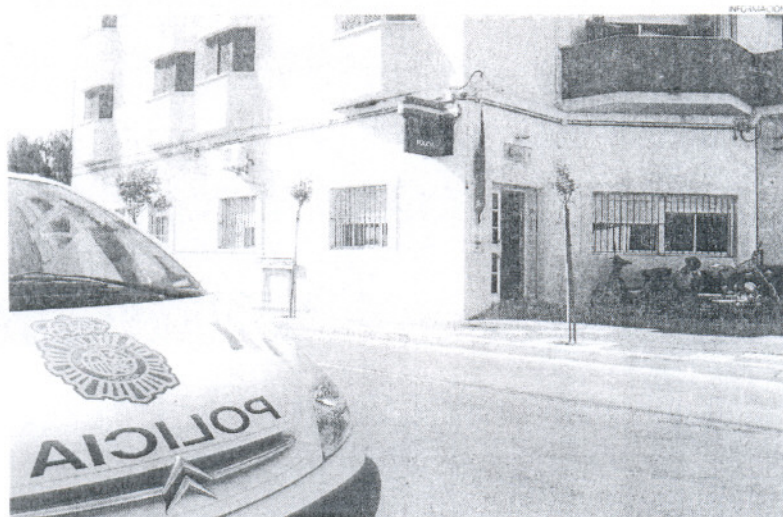
La actual Comisaría se encuentra en un edificio situado en la calle Zorrilla.