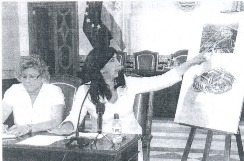
La portavoz municipal y la delegada de turismo explicaron las condiciones del convenio.

Además Corrales aclaró que esta empresa alemana dispone de una flota de un centenar de aviones, y cuenta también con más de 3.000 agencias de viajes, con una