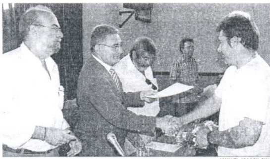
El delegado Provincial entrega los contratos.

Aunque la entrega de llaves se producía a comienzos de verano y