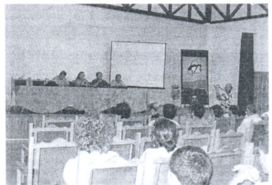
DEPORTE. El acto inaugural tuvo lugar en la Casa de la Cultura / A. R.

Estas jornadas formativas cumplen su tercera edición y permanece vinculada a la localidad bosqueña desde su nacimiento. Las mismas se celebran en el albergue juvenil Molino de En medio, don-