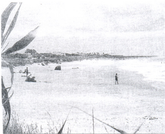
Imagen de la playa de El Palmar.