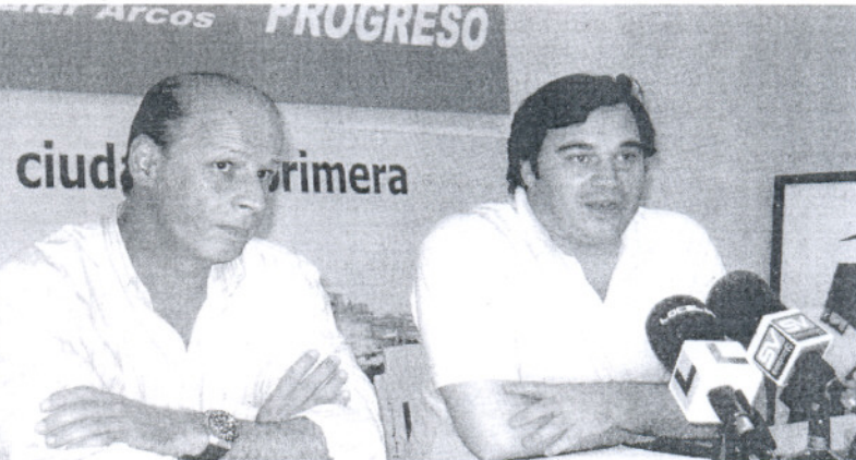
OPOSICIÓN. Los diputados provinciales del PP inician el curso político en la comarca serrana.