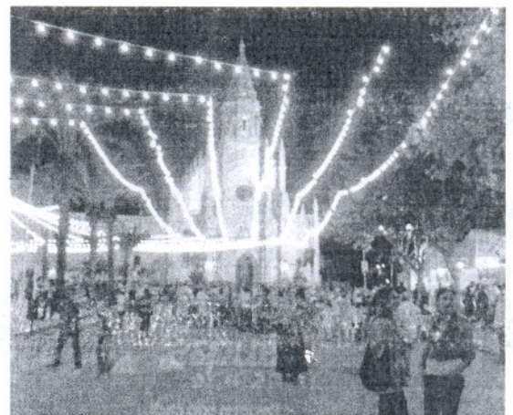
Esta noche los asistentes podrán disfrutar de actuaciones musicales.

que ha suscitado la recuperación de la tradicional ubicación de las Fiestas Patronales han sido las protestas de los vecinos de la zona del Paseo Marítimo que se quejan de que las casetas de movida juvenil se hayan situado