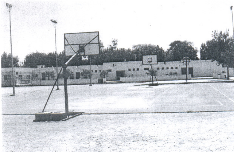
Las instalaciones deportivas de la zona llevan años sin sufrir obras de adecentamiento.

Según añadió Corrales, el Consistorio considera esta remodelación como «un proyecto de envergadura que necesitará de una importante inversión económica». De ahí que el Ayuntamiento ya se haya iniciado los contactos con la Junta de Andalucía y más concretamente con el director general de Infraestructuras Deportivas, para que participen y lo apoyen. «De momento, el Ayuntamiento va a encargar la realización del proyecto, el cual está presupuesta-