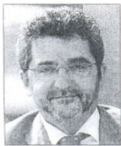
ALCALÁ DE GUADAÍRA. A. Gutiérrez Limones.