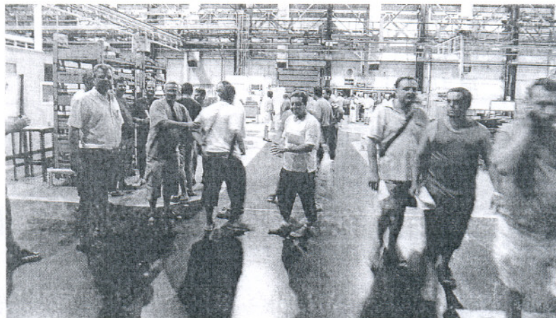
Un informe aconsejó la toma de medidas para mejorar la situación en 2005, aunque nunca llegaron. / o. ch.

situación de la factoría. La primera de ellas hace referencia al impacto que causó el anuncio de cierre sobre los pedidos de los clientes. De acuerdo con los datos de la empresa, los pedidos de productos se redujeron en un 28% de febrero –cuando la compañía hace pública su intención de cerrar– a marzo. Si se compara el volumen de negocio de marzo de 2006 y 2007, el descenso de las ventas se eleva a un 53%.