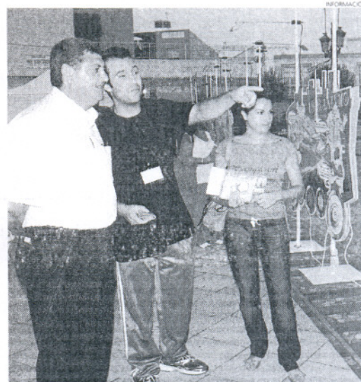
La muestra está compuesta por paneles informativos a modo de vagones.

El litoral andaluz cuenta con 1.100 kilómetros de longitud y 24.000 kilómetros cuadrados entre ámbito terrestre y marino, aglutinando en los sesenta y cinco municipios de la costa andaluza, que representan el diez por ciento del territorio andaluz, una población de 2,7 millones de habitantes, el treinta y cinco por ciento del total de Andalucía.