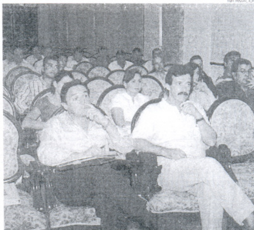
Alcaldes y representantes de municipios de menos de 50.000 habitantes.

Paralelamente a este impulso, Medio Ambiente va a llevar a cabo distintas campañas para fomen-