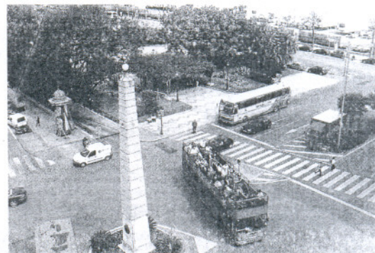
La avenida Ramón de Carranza será la vía principal.

Esta reordenación va a generar también algunos cambios urbanísticos tanto a nivel de semáforos como de pasos de cebra. También se rebajarán los bordillos de algunas aceras, se eliminarán plazas de estacionamiento y se eliminará la Zona Azul en las calles afectadas por los cambios.