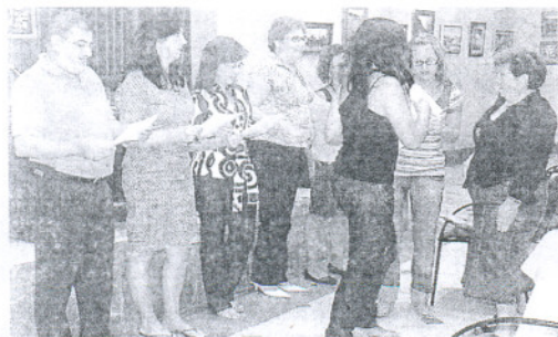
Las jóvenes recibieron los galardones.