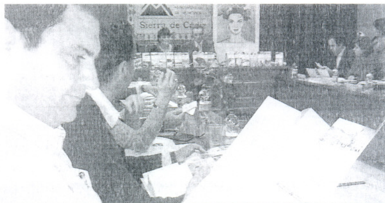
Un momento de la presentación en la Mancomunidad de la Sierra.