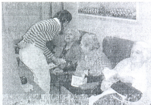
Las instalaciones estarán adaptadas a los mayores. / LA VOZ

aprobados en octubre de este mismo año por el Imserso y la Fundación ONCE, y subvencionados con 155.000 euros por ambas entidades; de manera que el Ayuntamiento aportará la cantidad restante hasta completar los 174.192 euros de inversión que