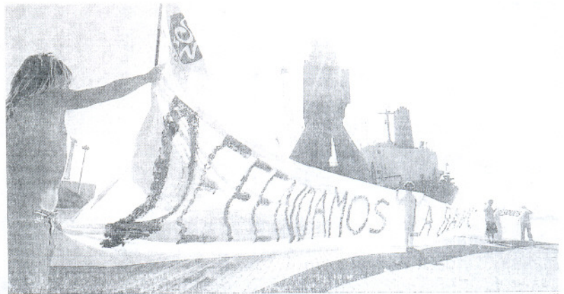
Un grupo de ecologistas desplegó una pancarta en la que se podía leer: "Defendamos la Bahía".

Sigún los Ecologistas, además del tráfico motorizado y de las industrias, uno de los mayores responsables de esta situación es el