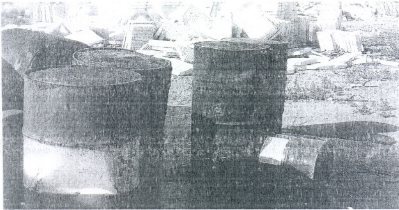
Estado de los bidones que se agrietaron y provocaron el peligroso vertido

Asimismo, recordaron al Consistorio que según la ley 20/1986, de 14 de mayo, Básica de Residuos Tóxi-